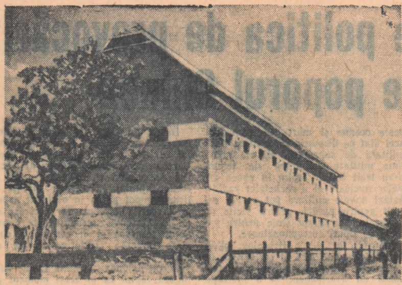
În dorința de a adăposti în condiții cit mai bune cerealele, colectivizii din comuna Anghelșu, Regiunea Autonomă Maghiară, și-au construit o magazie cit mai încăpătoare.

Ca rezultat al producțiilor mari obținute de întovărășiri din Copăliu, raionul Botoșani (cu peste 400 de kg de grâu la ha mai mult decît individuali) numai în luna august s-au înscris în întovărășirea „50