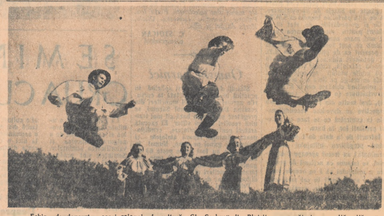
Echipa de dansuri a casei raionale de cultură „Gh. Coșbuc” din Blîrțija se pregătește cu multă grijă pentru un nou concurs.