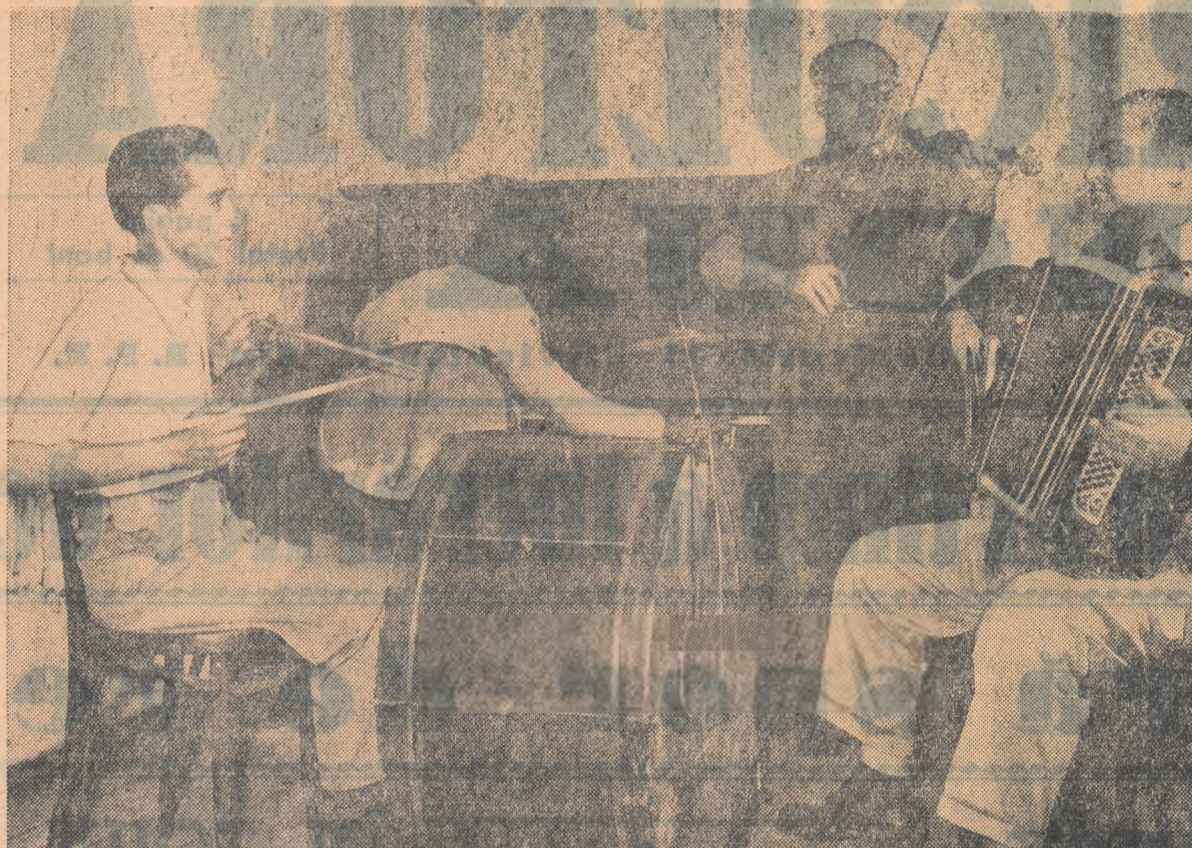
Orchestra gospodăriei agricole de stat Odobești, regiunea Galați, are o bogată activitate. Iată, în fotografie, pe membrii acesteia în timpul unui spectacol.

Zilele trecute, gospodăriile colective din regiunea Constanța au început să predea la bazele de recepție primele cantități de porumb și floarea-soarelui din noua recoltă. Numai în câteva zile li gospodării colective, printre care cele din comunele Beidau, Cotul Văii și Magieni au predat în întregime floarea-soarelui contractată. Pînă la 16 septembrie, gospodăriile colective din regiune au livrat statului, în baza contractelor încheiate, aproape 1.200 de tone de floarea-soarelui. În regiune a început și predarea porumbului contractat.