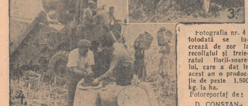
Fotografia nr. 4: totodată se lucrează de zor la recoltatul și treieratul florilor-soarelui, care a dat în acest an o producție de peste 1.800 kg. la ha.