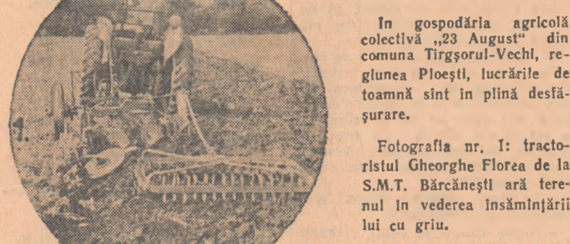
Fotografia nr. 1: tractorul Gheorghe Florea de la S.M.T. Bărcănești ară tere-nul în vederea însămîntării lui cu grîu.