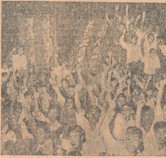
Studentii din Pekin — ca și ceilalți locuitori ai Capitalei R.P. Chineze — au participat la numeroase mitinguri de protest împotriva agresiunii americane.

Ar fi bine deci ca imperialismul american să tînă seama de avertismentele repetate ale R.P. Chineze și să tragă învățăminte din lecțiile istoriei. Taiwanul este pământ chinezesc iar americanii nu au ce căuta în China. Alături de marele popor chinez, popoarele lagărului socialist în frunte cu Uniunea Sovietică nu vor pregeta să-și aducă contribuția activă la stăvilirea agresiunii imperialiste, pentru a salva pacea lumii.