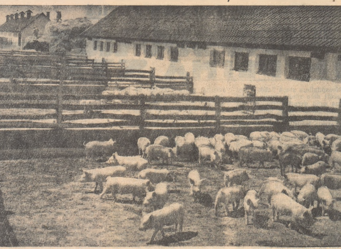
Ingrjiși și hrăniți bine, porcii aflați la crescătoria gospodăriei agricole de stat Giarmata, regiunea Timișoara, se dezvoltă normal încă din primele săptămâni, astfel încât la vîrsta de 8-10 luni ei pot fi livrați ca porci grași. În fotografie: un aspect de la crescătoria.