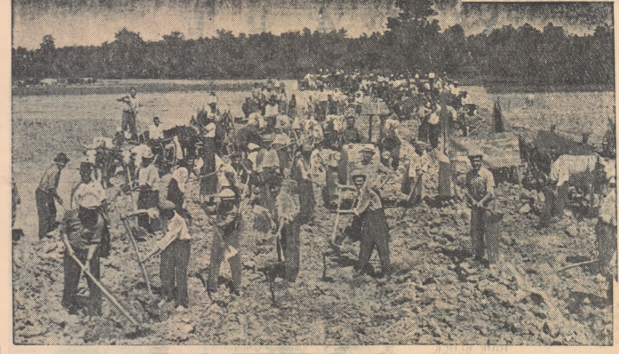
Desorei Jiul se revărsa inundind zece și sute de hectare de teren arabil. Pentru a stăvilii furia apelor, colectivitățile și întovărășiiți din comunele Dăbuleni, Căldărași din raionul Gura Jiului au pornit cu entuziasm la muncă. Iată-l în fotografie săpînd canale pentru scurgerea apelor.