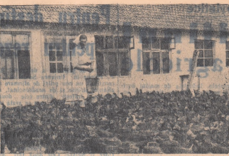
Să îngrijești 2.000 de păsări nu-l lucru de glumă. Cînd însă muncești cu trăgere de inimă, cu dragoste, treaba nu ți se mai pare aîd de grea. În fotografie: tovarășa Schweifel Maria îngrijește de păsări fruntașă de la gospodăria de stat Lăpușnic, raionul Deva.