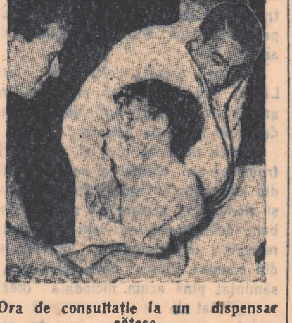
Ora de consultație la un dispensar sătesc.

Organizarea acestei munci de lămurire revine conducătorului secțiunii de ocrotire a sănătății al Consiliului raional (medic rural) a cărui activitate se desfășoară în strînsă colaborare cu Crucea Roșie Germană și cu alte organizații obștești cu, de pildă, Organizația Femeilor Democrată, Organizația de Tineret și Asociația pentru Răspîndirea Științei și Culturii. Asa-zisele "săptămîni ale curățeniei" organizate anual în fiecare raion, sînt foarte populare și asigură obținerea unor frumoase rezultate. În aceste perioade se revăd toate instalațiile sanitare, folosindu-se, în același timp, toate metodele de lămurire enumerate. Spre a atrage tot mai mulți medici și personal medical mediu să și exercite profesiunea la țară, medicii, stomatologii, farmaciașii și surorii, salariați al statului, primesc, pe lângă salariul de bază, un supliment salarial în cazul cînd își exercită profesiunea lor într-un centru rural.