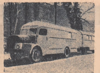
Caravană sanitară pentru populația rurală.

La 8 iulie 1954, Consiliul de Miniștri al Republicii Democrată Germană a publicat "Hotărîrea privitoare la continua dezvoltare a ocrotirii sănătății populației" care, între altele, prevede următoarele: