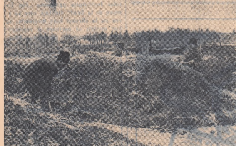
Cultura cartofilor a dat în anul acesta producții deosebit de frumoase la gospodăria de stat Hîlăucești, din raionul Pașcani. Acum după recoltare, muncitorii gospodăriei execută lucrările de însilozare a cartofilor pentru sămînță și consum. Pînă zilele trecute ei însilozaseră în 15 gropi, peste 150 tone de cartofi. În fotografie: brigada condusă de Leonte Constantin, executînt lucrarea de însilozare a cartofilor.