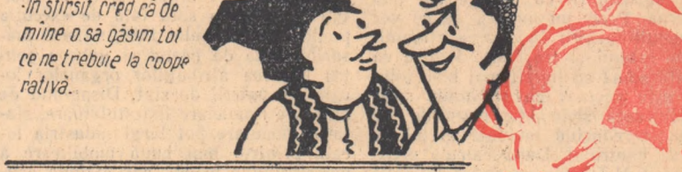
-In sfîrșit cred că de mine o să găsim tot ce ne trebuie la cooperativă.