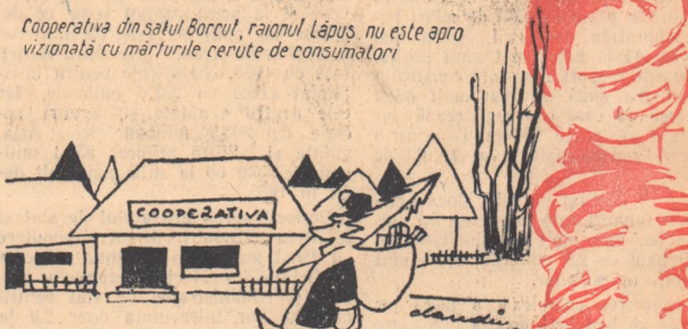
Cooperativa din satul Borcul, raionul Lăpuș, nu este apro vizionată cu măturile cerute de consumatori