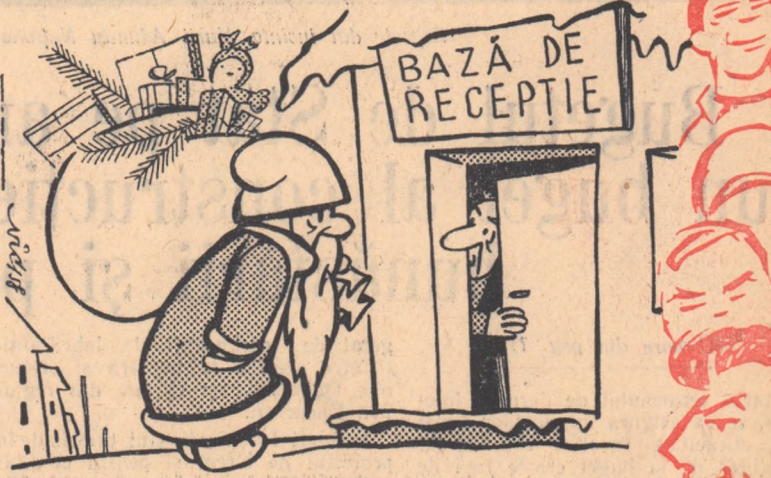
-Si crezi că pentru un sac ai dumitale o să mă deplasez eu din casă?