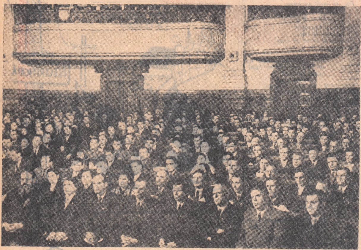
Aspect din incinta Marii Adunări Naționale.