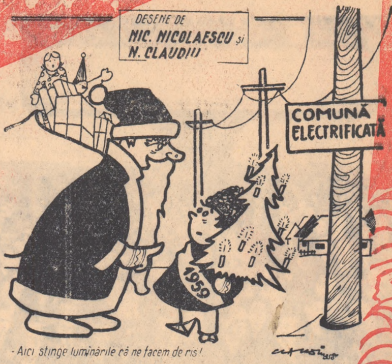
DESENE DE NIC. NICOLAESCU și N. CLAUDIU -Aici stinge luminările că ne facem de nis!