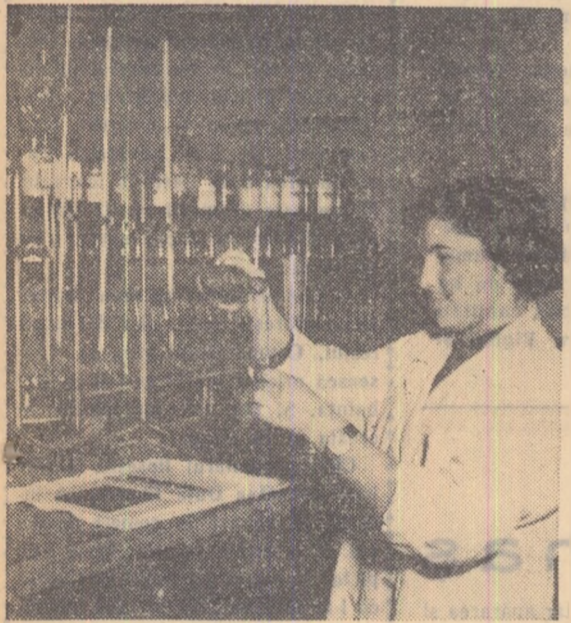
În laboratorul oenologic al gospodăriei de stat Odobești — raionul Focșani — se controlează cu regularitate concentrația în alcool a vinurilor din noua recoltă.