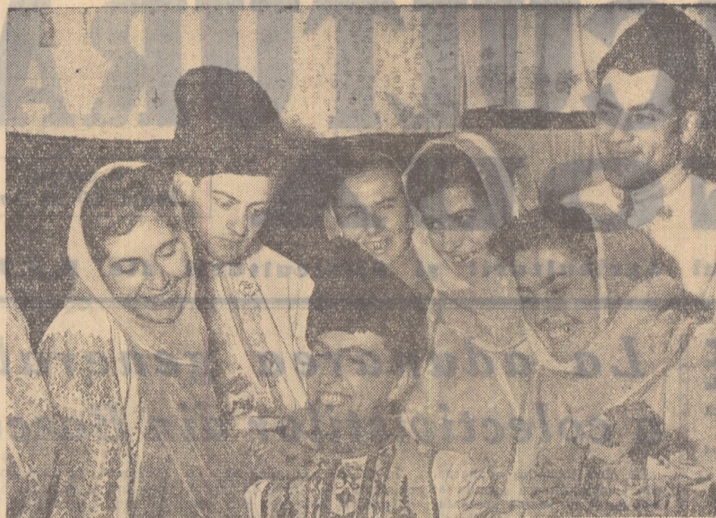
Sînt plini de voie bună tinerii țărani muncitori din comuna Măgura, regiunea Galați, și mindri de frumusețe portul lor vrîncean. Acum, în serile de iarnă, ei se string tot mai des pentru a pregăti împreună un nou program artistic.