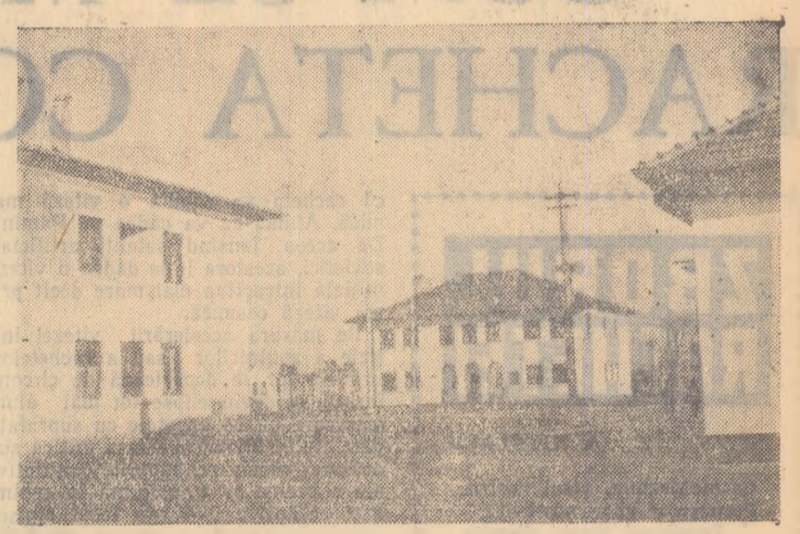
S.M.T.-Sărulești din regiunea București a dat în folosință muncitorilor săi noi apartamente. În fotografie: grupul social al stațiunii.