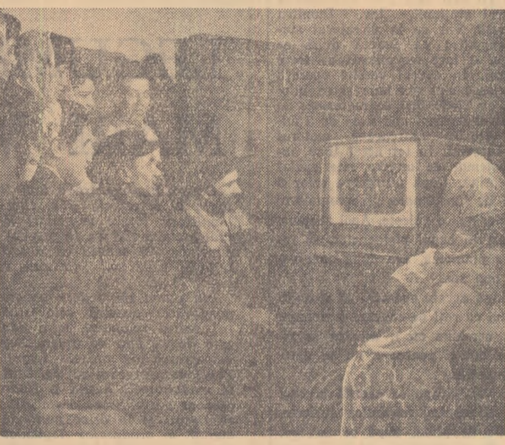
Dar aceasta nu e singura bucurie a unei zile. Seara la „colțul roșu” al colectiviei s-au adunat în fața televizorului numeroși tineri și vîrstnici. Ei urmăresc cu interes un program de cîntece și dansuri.