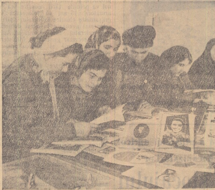
Au sosit noi cărți și reviste pentru tineret la „Librăria Noastră” din comuna Dragalina, raionul Călărași. Un grup de tineri colectivști, au și venit să cerceteze noutățile.