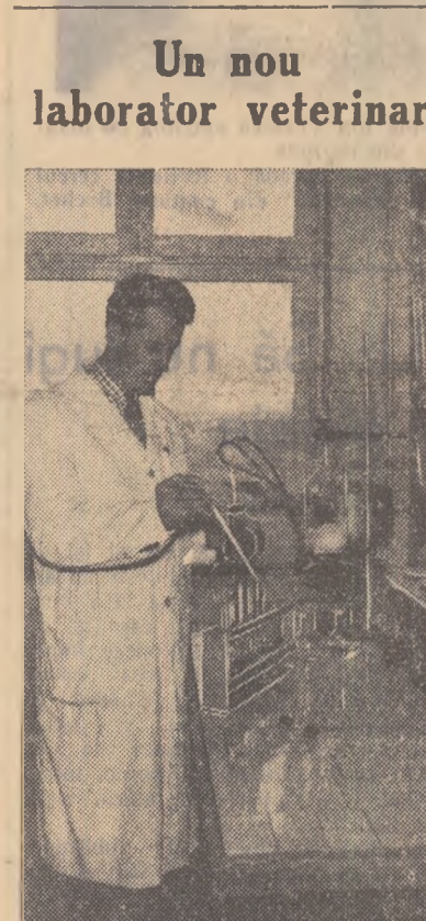
De curind în Timișoara a fost dat în folosință un laborator veterinar care deservete unitățile agricole socialiste și gospodăriile țărănilor muncitori individuali din întreaga regiune. In fotografie: Un aspect din timpul lucrului în laborator.