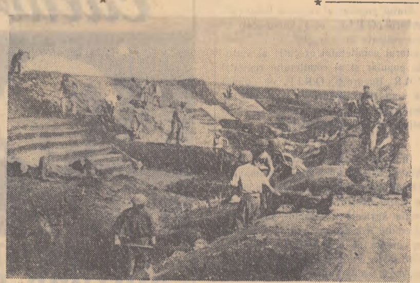
Un grup de colectivități din comuna Gotlob la lucru pe canalul principal Comloșul Mare—Grabăji—Jimbolia

Cele 3 canale lungi de peste 70 km pe care le sapă colectivității din Bulgăruș, Gotlob, Lenuaheim, Ieca Mare, Comloșul Mare și din celelalte sate ale raionului Jimbolia vor colecta apele ce înotau pînă acum locurile joase și astud. Il vor înzestra pe vrednicii colectivități cu peste 20.000 de hectare de pămînt bun pentru agricultură. V. CAZACU