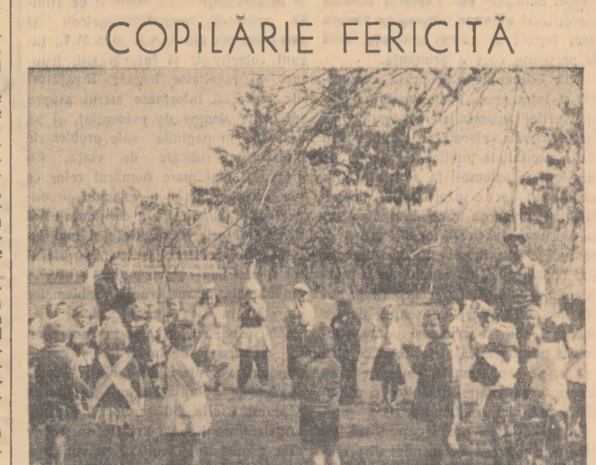
În grădina înflorită a gospodăriei colective, în aer liber, sub grija atentă a educatoarei, copiii colectivității din Lipia, raionul Buzău, se bucură de frumusețea acestor zile de primăvară, de copilăria lor fericită.