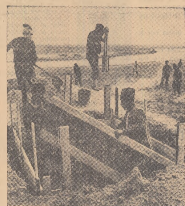
Membrii gospodăriei colective „Horia, Cloșca și Crișan”, din comuna Căzănești, regiunea București, acordă o mare atenție culturii orezului. În acest an ei vor cultiva cu orez o suprafață de 50 de hectare. În fotografie: colectivii lucrind la amenajarea orezării.

Ziua de 1 Mai a fost întimpinată de muncitorii, tehnicienii și inginerii gospodăriilor agricole de stat din regiunea București cu succese de seamă în campania muncilor agricole de primăvară. Astfel, gospodăriile de stat din această regiune au terminat de înșămîntat porumbul pe cele 26.500 de hectare cit au fost planificate. Întreaga suprafață a fost înșămîntată cu porumb dublu-hibrid. Multe gospodării de stat ca cele din Alexandria, Bălteni, Belciugatele, Ivănești și Storoabăneasa au înșămîntat cîte 100—250 de hectare cu porumb peste plan. Recoltele mari obținute la porumb în anii trecuți de pe terenurile din baltă, au determinat gospodăriile de stat Roseji, Chirnoși, Băneasa, Călărași, Oltenița și altele să înșămînteze și în anul 1959 porumb pe aceste terenuri. Suprafața de teren înșămîntată în baltă cu porumb trece de 4.000 de hectare.