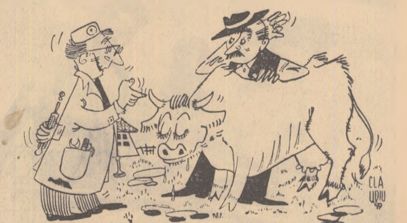
— E nesănătoasă vaca??? — Așa! Nesănătoasă e obiceiul consiliului de conducere de a schimba des îngrijitorii!!! Desen de N. CLAUDIU

La G.A.C. Bonțida — raionul Gherla — consiliul de conducere schimbă des îngrijitorii de animale ceea ce contribuie la scăderea producției de lapte.