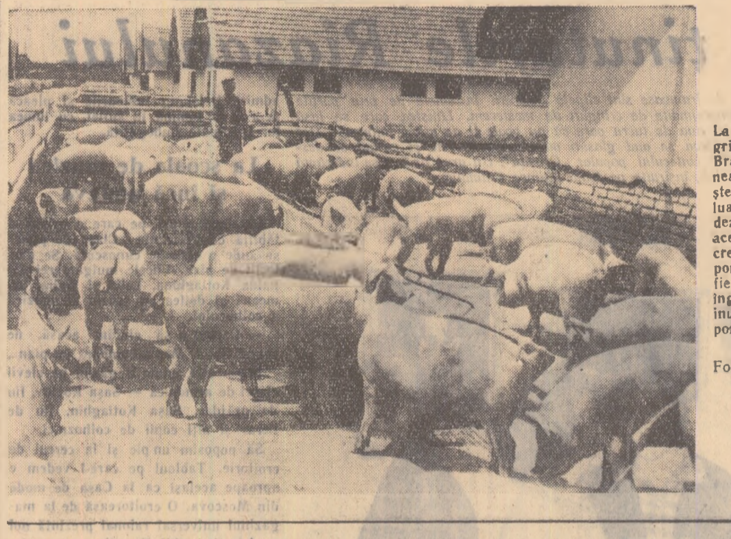
La gospodăria agricolă de stat Bragadiru, regiunea București, creșterea vacilor a luat o deosebită dezvoltare. Anul acesta gospodăria crește 5.200 de porci. În fotografie: unul dintre îngrijitorii dintr-unul de dimineață porcii-puși la îngrașat.