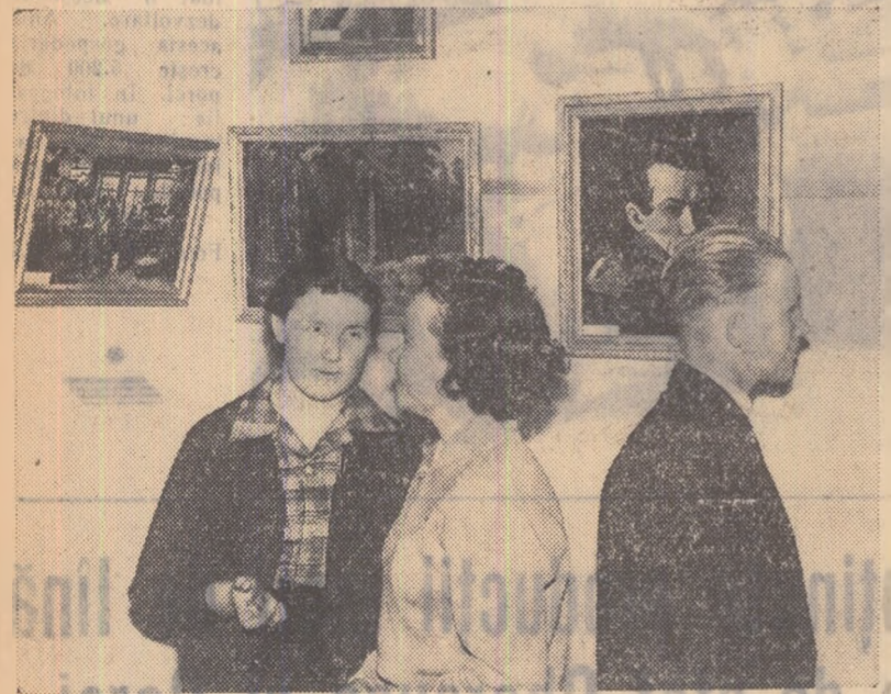
La expoziția de pictură de la clubul colhozului „Rossia” din satul Baturino.