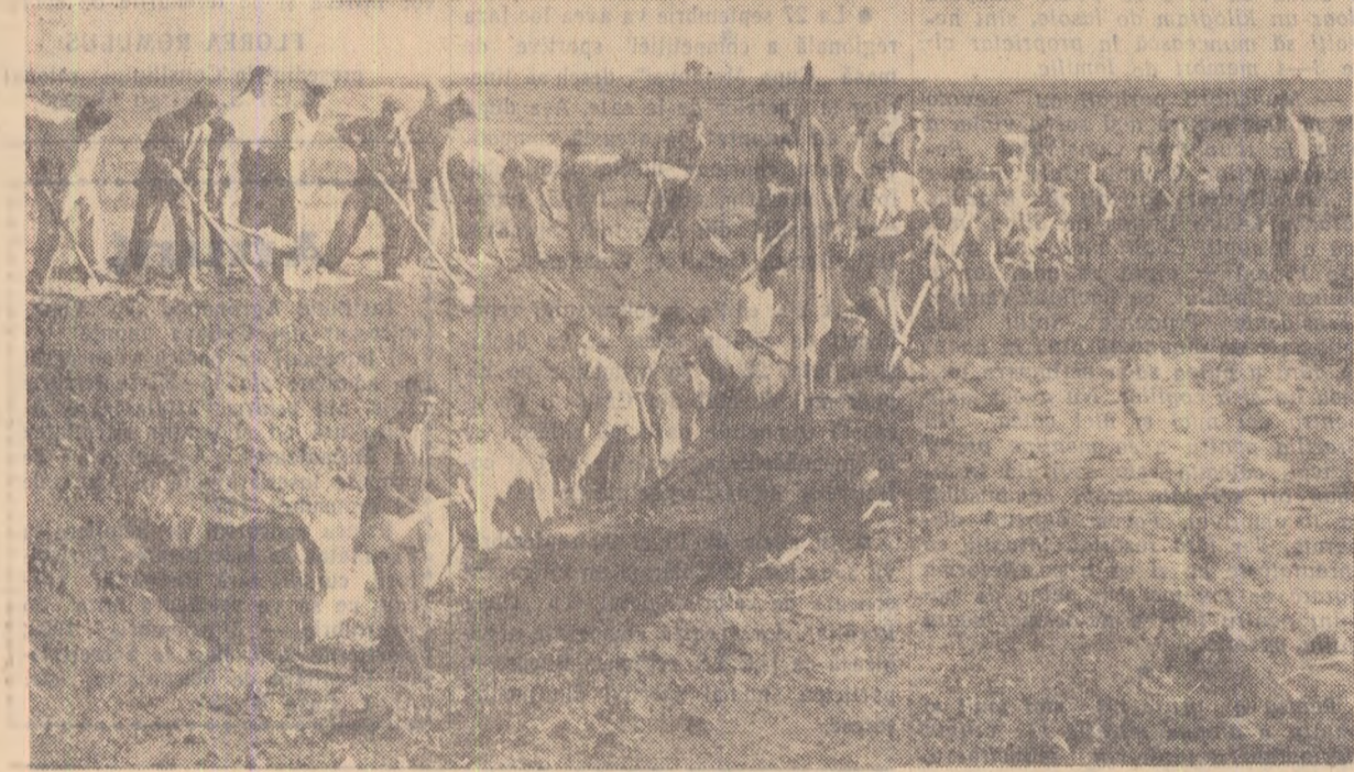
Cu fiecare metru de pămînt săpat, canalul Stoenței-Scărișoara înaintea