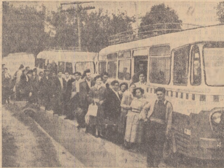
Privelește minunații ale țării trebuie cunoscute ca și tot ce au realizat oamenii muncii din țara noastră în anii aceștia. Iată-i pe muncitorii, tehnicienii și inginerii de la gospodăria de stat Cotești, plecînd într-o excursie.