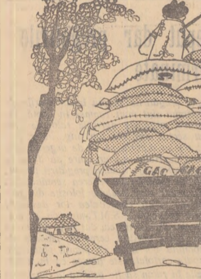
ȚĂRANUL CU GOSPODĂRIE INDIVIDUALĂ: — Na, că l-am prins din urmă pe colectivist! Acum dacă vreau pot să-l și întrec!