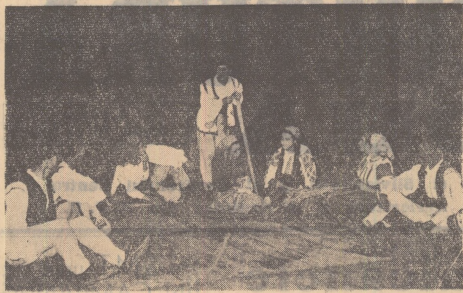
La căminul cultural din comuna Franzaru — regiunea Pitești, a fost organizată o valoroasă brigadă de agitație artistică. În fotografie: brigada executînd o scenă în care interpreții discută (la o șezătoare) despre foloasele muncii în comun.