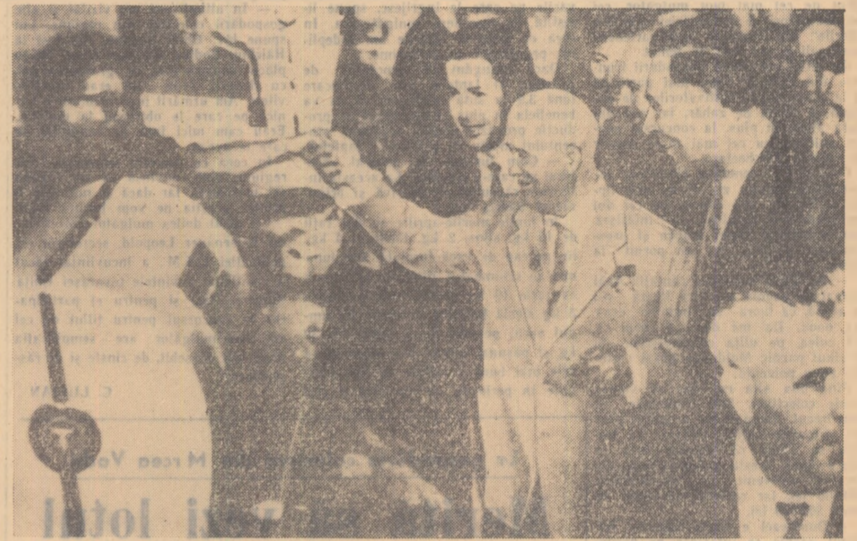
La San Francisco N. S. Hrușciiov a făcut o vizită la unul din bufețele automate.

Opinia publică mondială continuă să urmărească cu cel mai mare interes vizita tovarășului Nikita Sergheevici Hrușciiov.