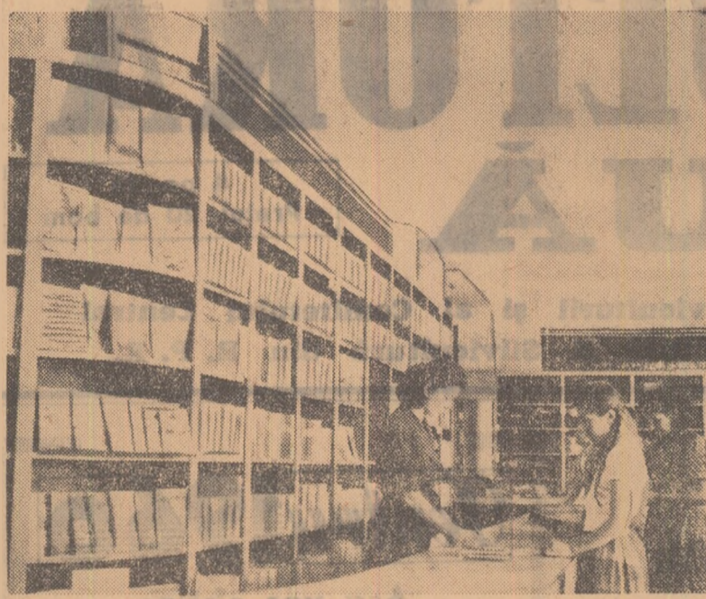
În comuna Vinga, raionul Arad, a luat ființă și o librărie. Aci, școlarii găsesc acum, la începutul noului an de învățămînt, cărțile și rechizițele trebuincioase. În fotografie — citiva elevi cumpărînd cărți și caiete