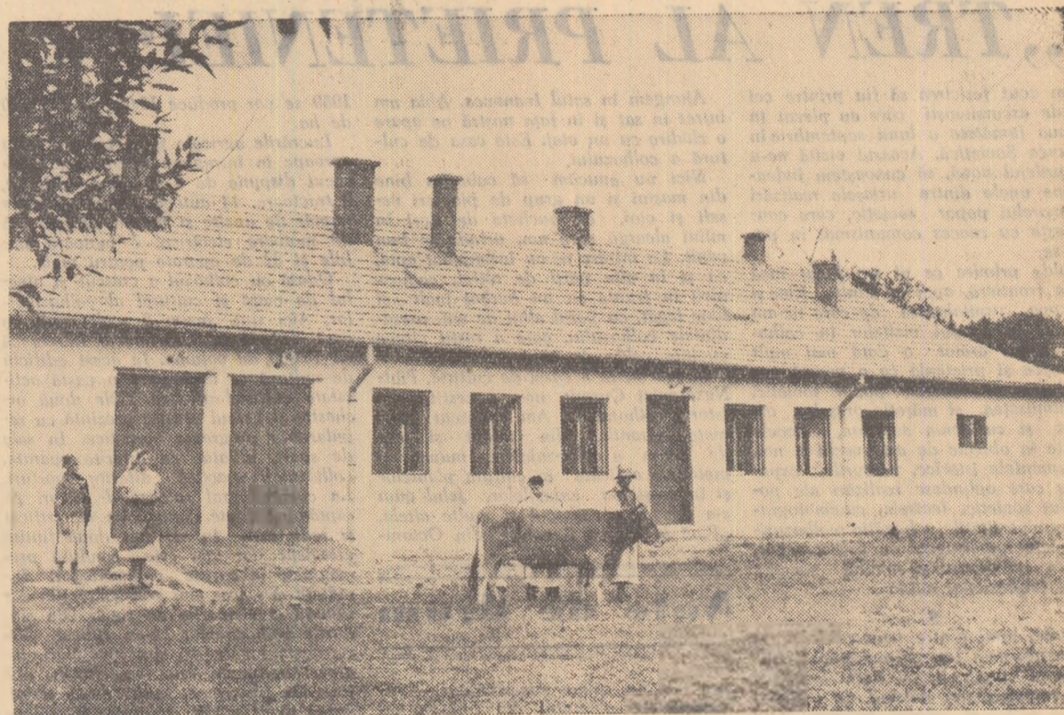
În comuna Giulești, raionul Sighet, s-a ridicat de curind un nou dispensar veterinar.