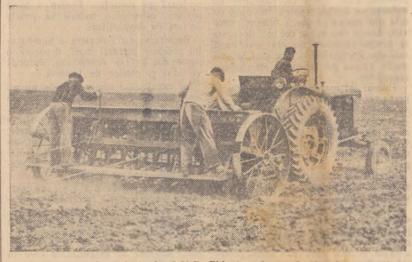
Vrednicii mecanizatori de la S.M.T. Ziduri, raionul R. Sărat, se străduiesc să termine la vreme lucrările contractate cu unitățile din raza lor de activitate. În fotografie: tractoristul Homor Nicolae, zorind însămînțatul grâului pe o tarla a gospodăriei colective din Măcina.