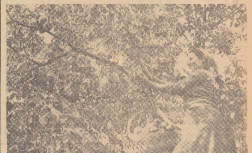
La gospodăria de stat Ștefănești, regiunea Pitești, recoltatul fructelor e în toi. În fotografie: muncitoroarea Florica Șerban, culegînd mere Ionathane.