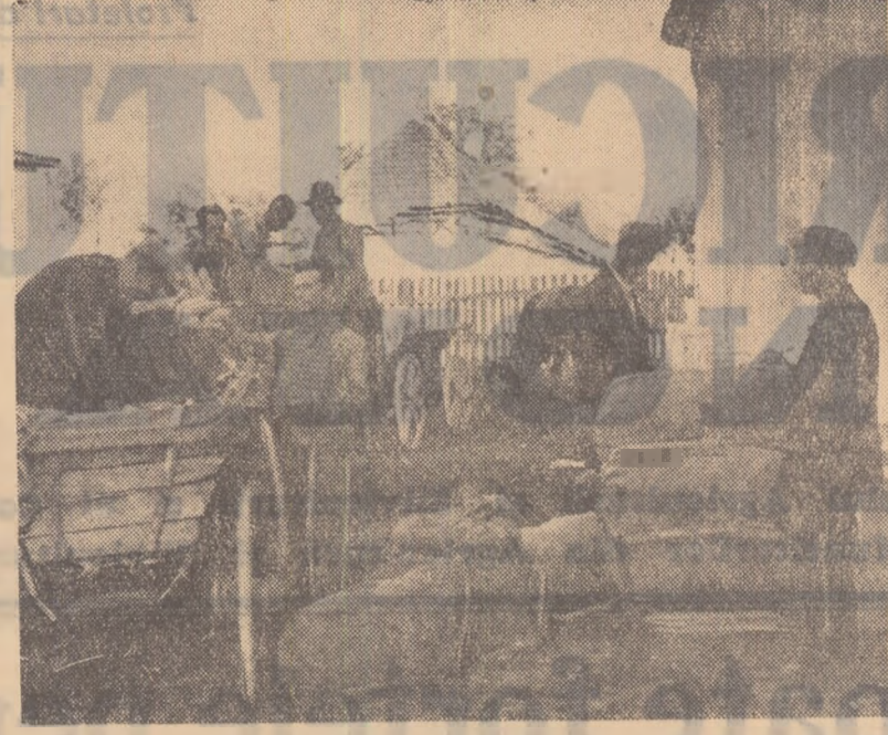
La baza de recepție din Leordeni, regiunea Pitești, seosec zilnic căruțe încărcate cu diferite produse. În fotografie: colectiviștii din Călinești care au obținut în acest an 2.600 kg porumb boabe la hectar au adus un transport de 5.000 kg porumb contractat cu statul.