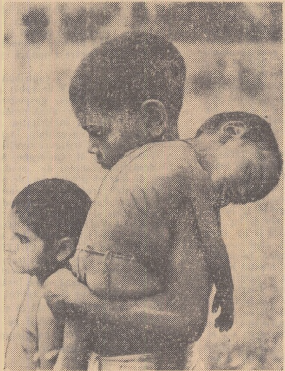
Copii africani rămași singuri după ce părinții lor au fost trimiși la muncă forțată.

Samalke, care a cîntăreac anul acesta în lung și-n lat Mozambic a demascat ororiile văzute de el. Între altele, Samalke povestește, cîntăreac de groază, despre cele văzute într-un loc de muncă forțată situat pe coasta Oceanului Indian. „Am văzut acolo oameni care și-au pierdut chipul de om — scrie Samalke în ziarul „Sunday Times” — Munca isivitoare, foamea, maldara, disperarea toate acestea au izbutit să ucidă — numai în 1958 — 10.000 de africani. Am văzut