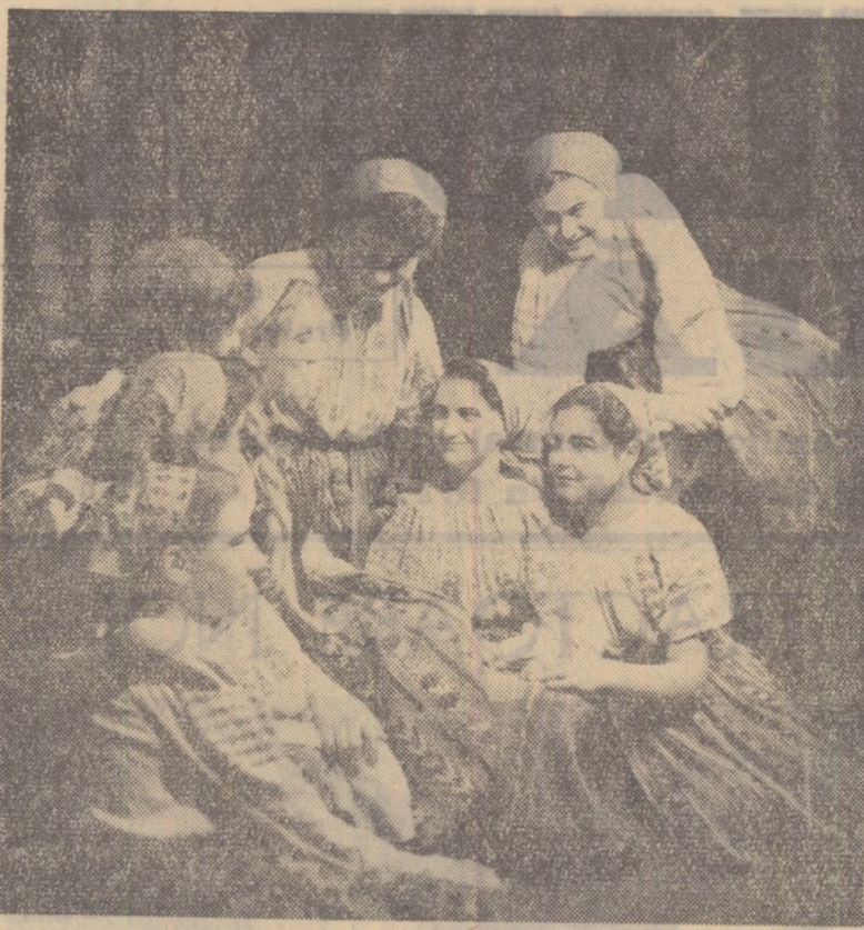
Ne aflăm la căminul cultural din comuna Răcăciuni, regiunea Bacău. Ați ghicit? E vorba de o scenă prezentată de către formația de teatru a căminului, scenetă în desfășurarea căreia — cum ușor se poate deduce din fotografie — interpretează scene ghicitori pline de tîlc sau cîntă melodii pline de via.