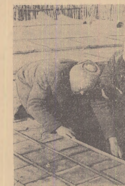
La gospodăria colectivă „Ilie Pintilie” din satul Dobreni, comuna Vărăști, regiunea București, sectorul legumicol la o mare extindere în acest an. In fotografie: Mai mulți colectivștii lucrînd la răsădnite.

Pentru a obține și în acest an recolte bogate, membrii gospodăriei agricole colective „Secera și Ciocanul” din comuna Răcăciuni, raionul Bacău, se pregătesc din vreme pentru campania însămițărilor de primăvară. Pînă acum ei au reparat 3 semănători, 8 boroane și 7 pluguri, au condiționat 2.000 kg. de sămînță și au transportat la cîmp, numai în ultimele cîteva zile, peste 100 tone de gunoi de grajd bine putrezit.