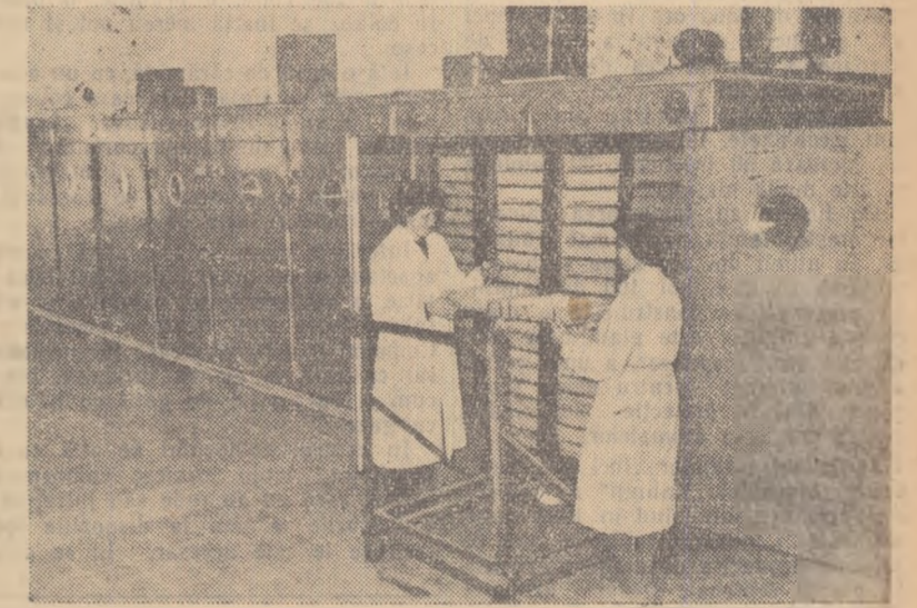
Unul din incubatoarele de mare capacitate ce funcționează la Aradul Nou.

PENTRU 3000-3500 DE LITRI DE LAPTE PE CAP DE VACA PENTRU SUB 1 LEU PREȚ DE COST PER LITRU