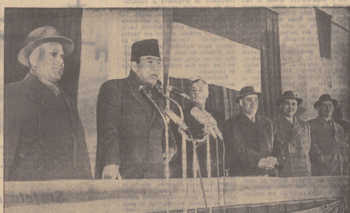
Președintele Sukarno roștindu-și cuvântul la mitingul oamenilor muncii din Capitală.

Președintele Republicii Indonezia, dr. Sukarno, răspunzând invitației președintelui Prezidiului Marii Adunări Naționale a R. P. României, Ion Gheorghiu Maurer, și a președintelui Consiliului de Miniștri al R. P. României, Chivu Stoica, a fost timp de trei zile oaspele al țării noastre.