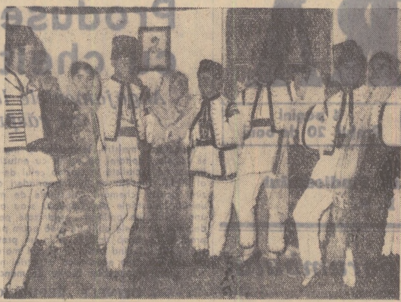
La gospodăria de stat Drăgășani, regiunea Pitești, a fost organizată o bună echipă artistică, din care face parte și formația de dansuri naționale. În fotografie: muncitorii și muncitoarele de la secția 5-a ce fac parte din echipa artistică executând un dans din regiune.