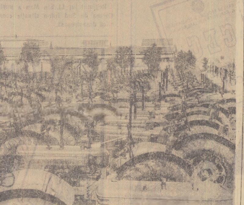
În fiecare lună vrednicii muncitori de la uzinele „Ernst Thälmann” din Orașul Stalin trimt oamenilor muncii de pe ogoare noi loturi de tractoare UTOS—27. În fotografie: noi tractoare care, după ce li s-a făcut ultima revizie, urmează a fi imbarcate în vagoane și pornite în diferite regiuni ale țării.