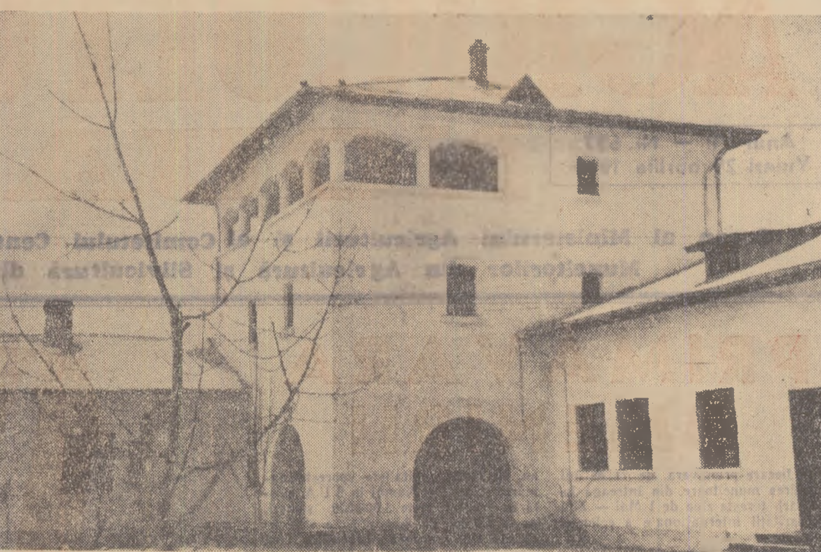
În comuna Mihail Kogălniceanu, raionul Tulcea, a fost ridicat un Impunător cîmin cultural (cel ce se vede în fotografie) prevăzut cu sală spațioasă de spectacole, cinematograful, bibliotecă, sală de lectură etc.