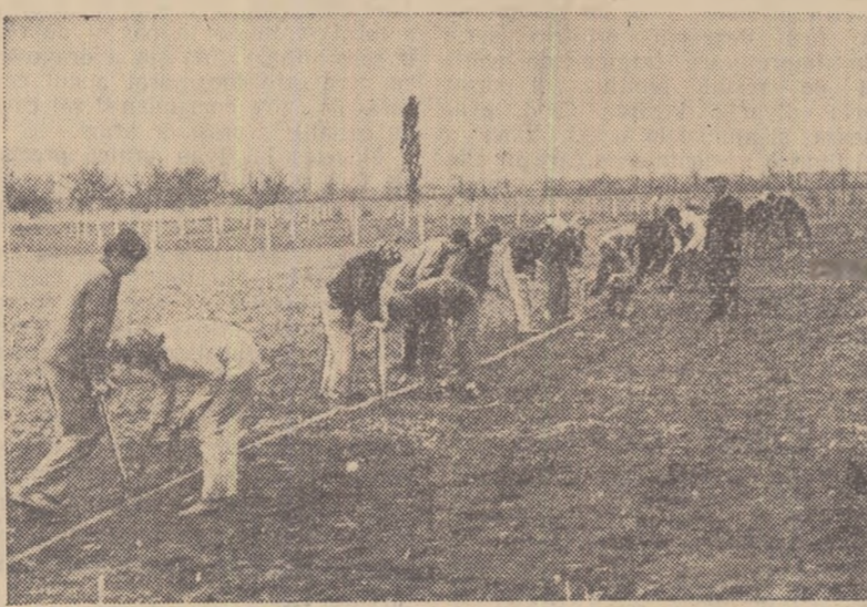
Elevii Centrului școlar agricol din Clacova, regiunea Timișoara, execută, în cadrul acțiunilor de muncă patriotică, plantarea unei pepiniere pomice.