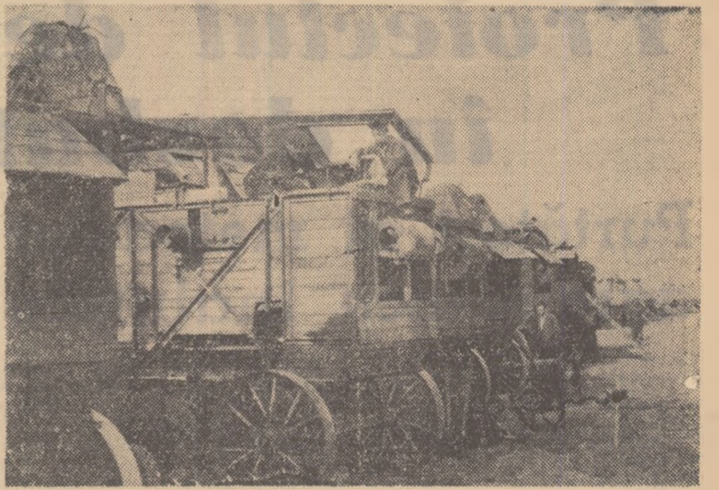
Pregătirile pentru noua recoltă au fost începute din vreme. La S.M.T. Făurei, din ralonul Fillimon-Sîrbu, se fac reparațiile necesare batozelor.