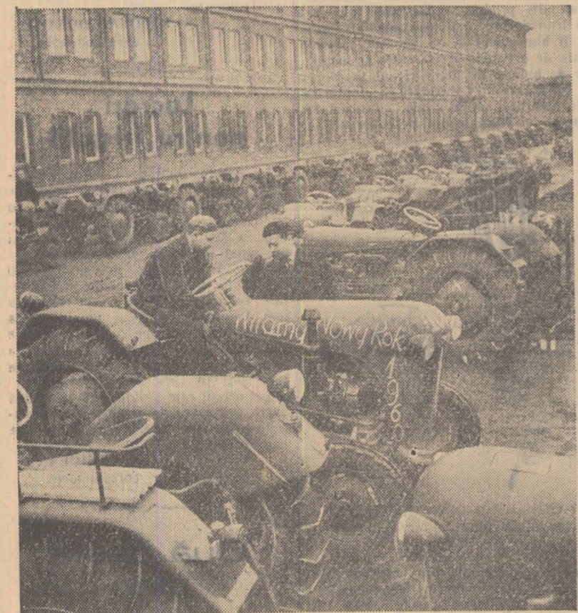
Industria de tractoare a R.P. Polone este în continuă dezvoltare. În cursul acestui an, agricultura țării va primi încă 6.000 de noi tractoare „Ursus — C. 325”. În fotografie: controlul unui noi de tractoare ce urmează a fi expediate.