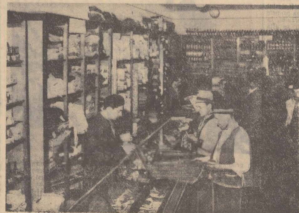
În fiecare zi la magazinu universal al cooperativității din comuna Smeeni, raionul Buzău, vin după diferite cumpărături — așa cum se vede și în fotografia de față — numeroși țărani muncitori. Ei sînt pe deplin mulțumitori de buna aprovizionare a magaziniului și calitatea mărfurilor.