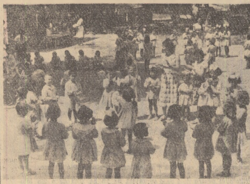
Copiii colectivității din comuna Pecineaga, regiunea Constanța, li s-a amenajat o frumoasă grădiniță sezonieră. În fotografie: Copiii jucîndu-se în aer liber.