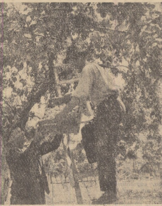
Gospodăria agricolă colectivă din Chiselet, regiunea București, are o frumoasă livadă de pomi. De curînd casele s-au copleșit cu colectiviștii au început recoltatul.