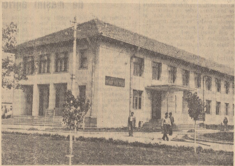
Printre noile construcții ridicate în ultimii ani în comuna Smeeni, raionul Buzău, se numără și un modern spital dat de curînd în folosință.