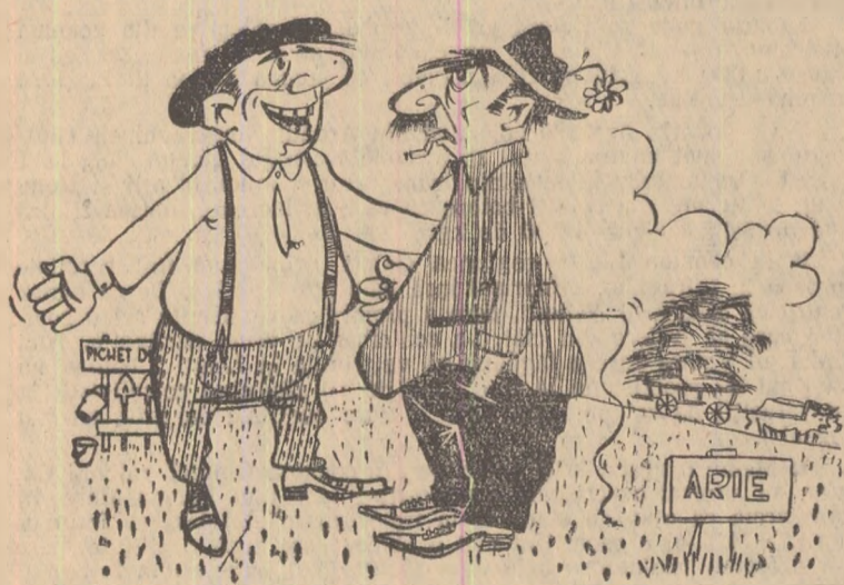
— Am sosit și eu la treier și batoza năclăeri. — Să fii sănătos, năstă, noi am terminat de teri. Cum se vede, în anul acesta tu veniși cam tîrziu. Și fîrește prea devreme pentru... anul viitor!

Cu zece ani în urmă, pe la sfîrșitul lui mai, mă aflatam la Plăești, în raionul Turda. Luam parte la inaugurarea gospodăriei colective „Petőffi Șandor”, prima gospodărie colectivă din raion.