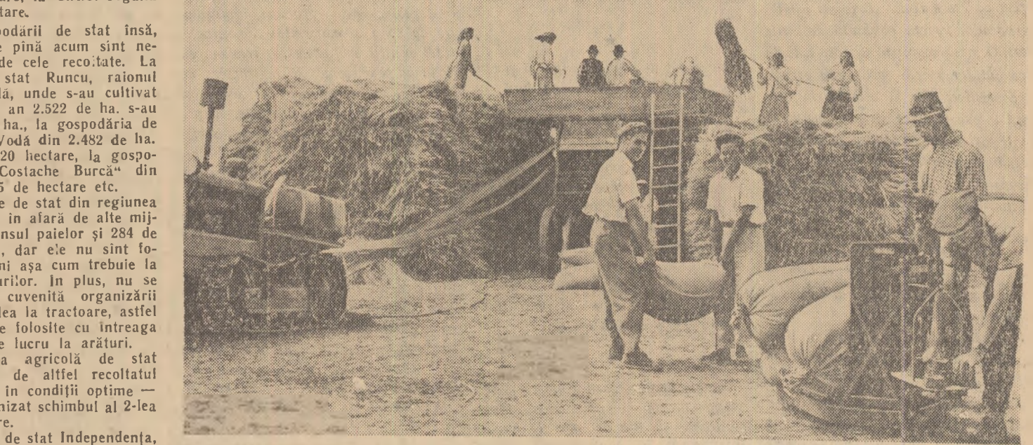
La aria gospodăriei agricole colective „Al III-lea Congres” din comuna Ileana, raionul Lehliu, se treieră din plin.