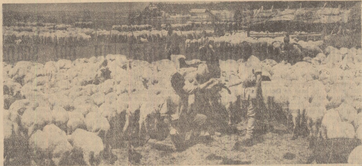
La gospodăria de stat Dragalina — regiunea București, a fost dezvoltat mult sectorul ovin. În fotografie: una din turmele acestel unități.