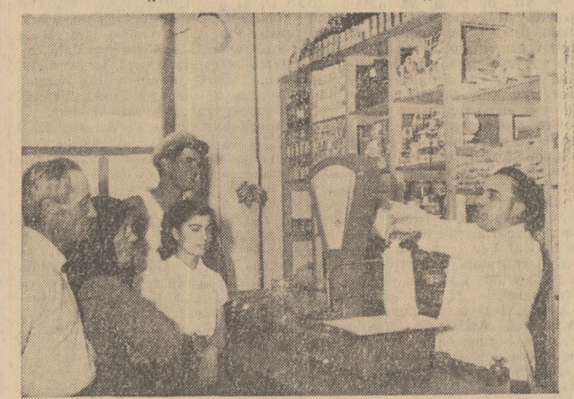
În magazinul universal din comuna Ion Roată, raionul Urziceni, au venit luni cumpărători mai mulți ca de obicei.

În magazinele din Slobozia, regiunea București, s-a putut observa zilele acestea o mai mare afinență de vânzătorii ca de obicei. Printre aceștia se aflau și numeroși colecțivisti, care cumpărau mărfuri alimentare și industriale, ca pantofi, ceasuri deșteptătoare, produse textile etc. Stînd de vorbă cu unii dintre ei am aflat că în primul semestru din acest an, gospodăriile colective din raion au obținut venituri de seamă. Ca urmare a creșterii veniturilor toate gospodăriile colective din raionul Slobozia au repartizat în acest an avansuri bănești trimestriale sau lunare de cîte 5—7 lei la ziua-muncă. Nu e deci de mirare că mulți membri ai gospodăriilor colective puteau fi înțînți acum, după noua reducere de prețuri hotărîită de partid și guvern, în magazinele din Slobozia.