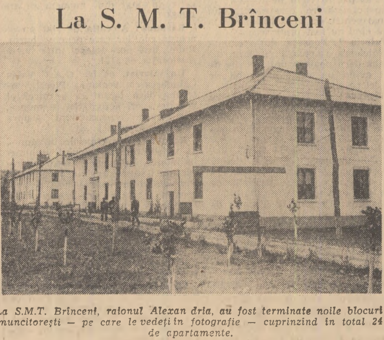
La S.M.T. Brînceni, raionul Alexan dria, au fost terminate noile blocuri muncitorești — pe care le vedeți în fotografie — cuprinzînd în total 24 de apartamente.