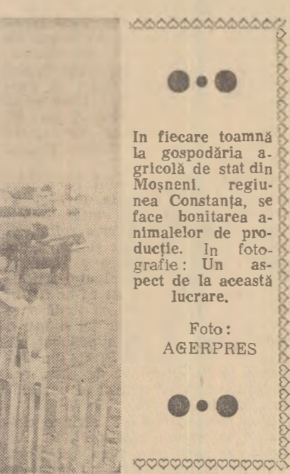
În fiecare toamnă la gospodăria agricolă de stat din Moșneni, regiunea Constanța, se face bonitarea animalelor de producție. În fotografie: Un aspect de la această lucrare.

Pentru a asigura aplicarea măsurilor și lucrărilor de conservare a solului pe terenurile arabile și a celor