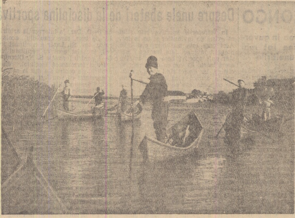
Printre alte ramuri de producție aducătoare de venituri, gospodăria agricolă colectivă din comuna Somaș, raionul Tulcea, are și un sector piscicol bine dezvoltat. În fotografie: brigada piscicolă a gospodăriei, pornind la lucru.