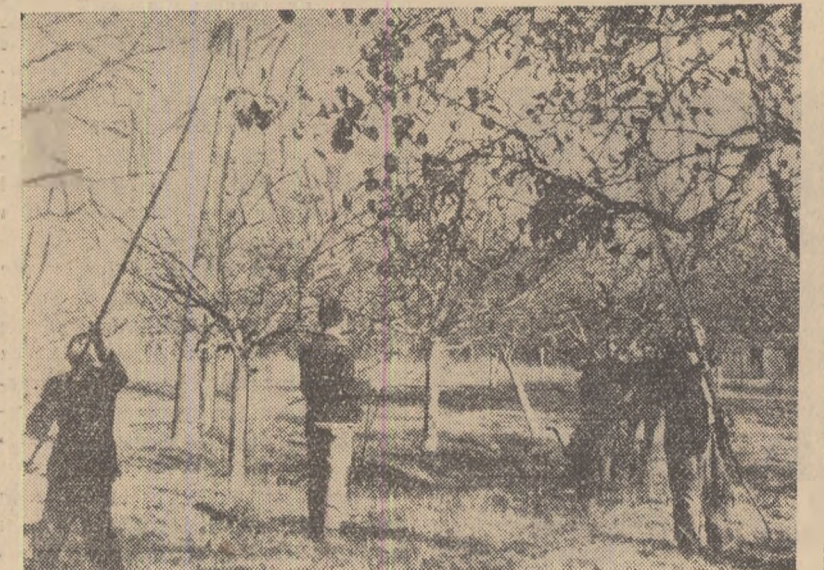
O măsură care contribuie la obținerea unei producții sporite de fructe la hectar este lupta contra dăunătorilor pomilor. În fotografie: un aspect de la stropitul de iarnă al pomilor în livada gospodăriei de stat Băicoi, regiunea Pitești.