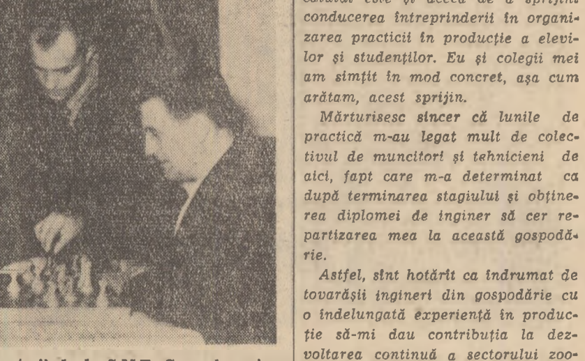
Seara, după o zi de lucru, mecanizatorii de la S.M.T. Caracal, regiunea Craiova, vin la clubul stațiunii unde își petrec timpul liber, citind o carte, vizionînd un spectacol la televizor, sau jucînd o partidă de șah, așa cum se vede în fotografie.