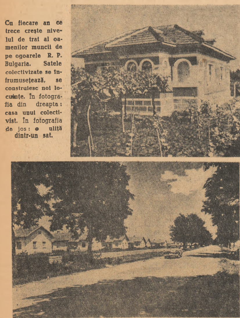
Cu fiecare an ce trece crește nivelul de trai al oamenilor muncii de pe ogoarele R. P. Bulgaria. Satele colectivizate se înfrumusețază, se construiesc noi locuințe. În fotografia din dreapta: casa unui colectivizat. În fotografia de jos: o uliță dintr-un sat.