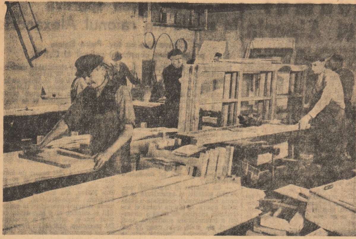
La gospodăria agricolă colectivă „8 Martie” din comuna Urziceni, raionul Căciulă, a fost înființat și atelierul de timpărie. În fotografie: meșterii gospodăriei, la lucru.