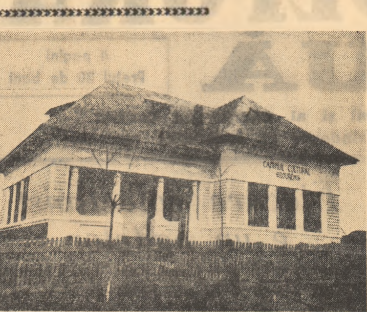
De curînd, în comuna Borent, raionul Pașcani, a fost dat în folosință acest frumos cîmînt cultural.