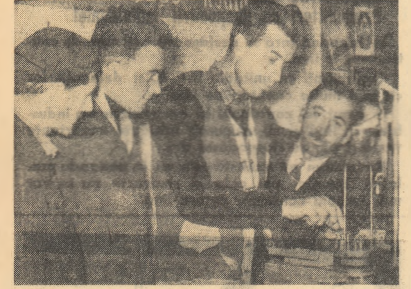
In laboratorul gospodăriei colective din comuna Sîrbi, raionul Birlad, se stabilește greutatea hectarului de semințele.

În afară de masa verde la discreție, vacile au primit în tabăra de vară și concentrate industriale cîte 250 de grame pentru fiecare litru de lapte.