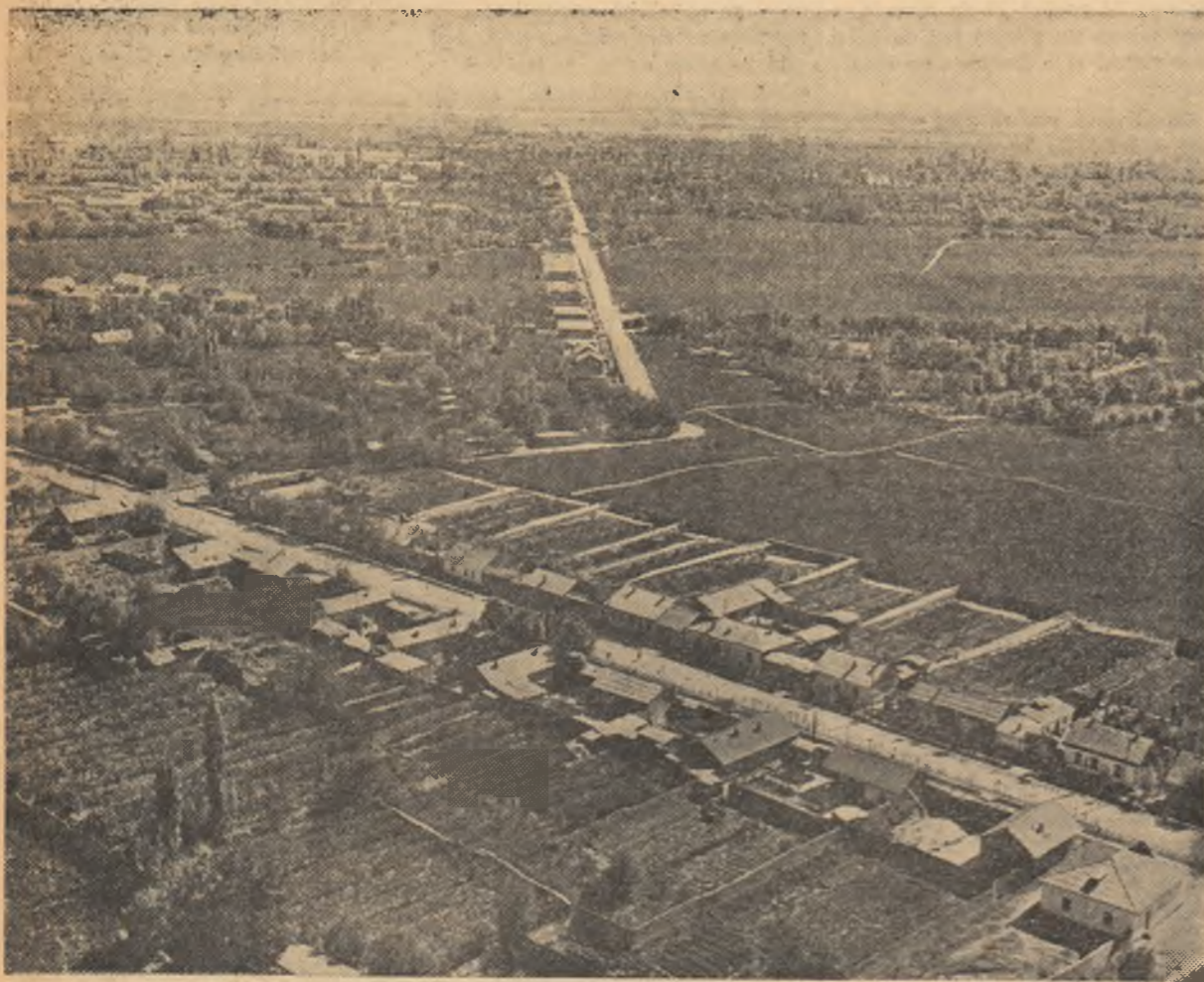
Orînduirea colhoznică a adus bunăstare satului sovietic. Cu veniturile realizate din gospodăria obștească, colhoznicii construesc case noi și frumoase. În perioada dintre anii 1946 și 1960 s-au construit în localitățile rurale din Uniunea Sovietică aproape opt milioane și jumătate de case individuale...