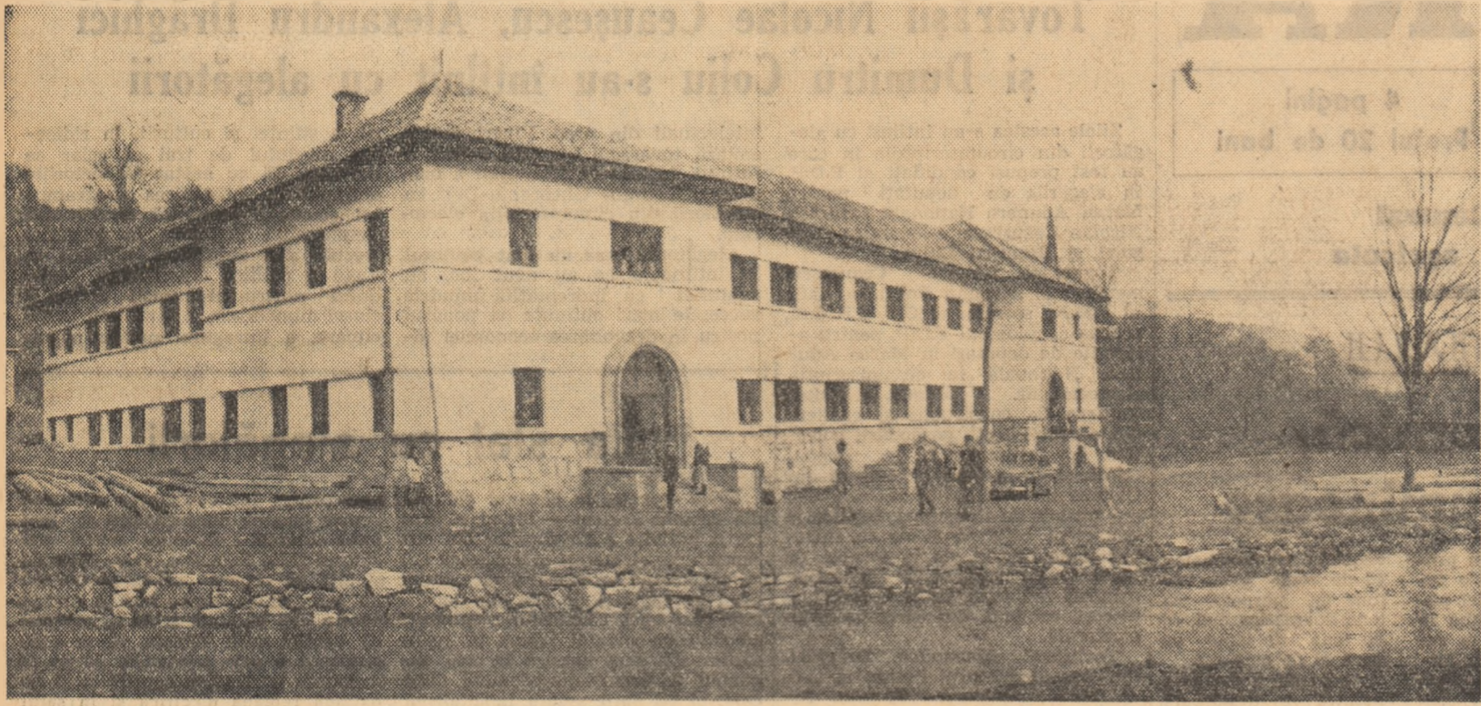
Tara Moților era cunoscută în trecut ca un loc al mizeriei și neștiinței de carte. Azi, în satele și comunele din aceste locuri au pătruns și pătrund lumina și cultura. În fotografie: școala nouă de 7 ani din comuna Sobodol, raionul Cimpeni, unde învață mai bine de 300 de copii de moși.