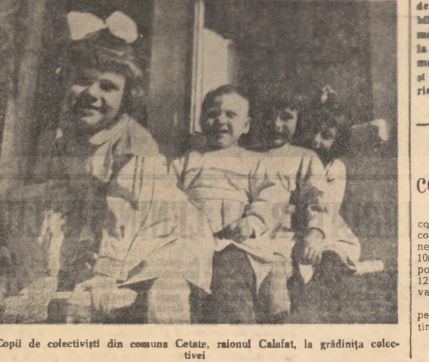
Copii de colectivități din comuna Cetate, raionul Calafat, la grădinița colectivă