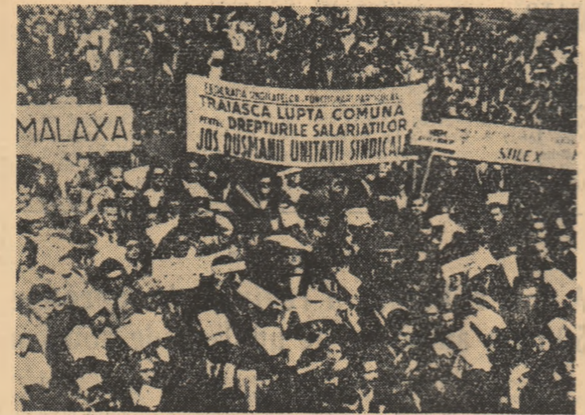
1945: Zece de mii de oameni din Capitală îl ascultă pe tov. Gheorghe Gheorghiu-Dej.

torul a trimis aliatului său de la sate un tractor mereu mai bun, mai perfecționat. Primele 76 de stațiuni de mașini și tractoare înființate în 1948 au fost tot atîtea puncte de sprijin în lupta țărănimii pentru belșug. A continuat să crească numărul S.M.T.-urilor, avem astăzi 244, a continuat să crească numărul de tractoare, avem astăzi 43.000. Această cifră a tractoroarelor, poate că nu ne mai impresionează. Realitățile noastre de astăzi ne-au obișnuit cu cifrele, oricît de mari ar fi ele. Să le compărăm atunci cu cele dintr-un trecut nu prea îndepărtat. În anul 1938, existau în toată România burghezo-mo-