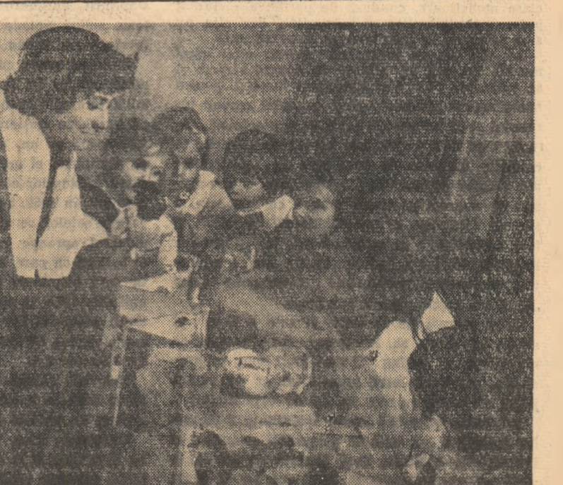
Jucările — bucuria copiilor. În fotografie, copii colectivității din Drăgălina, regiunea București, la grădinița gospodăriei.