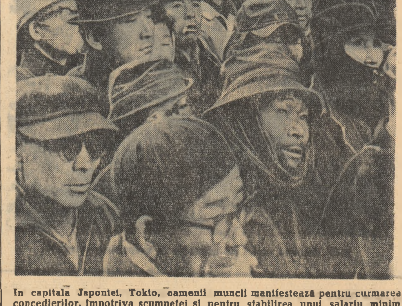
În capitala Japoniei, Tokio, oamenii muncii manifestează pentru curmarea concedierilor, împotriva scumpetii și pentru stabilirea unui salariu minim garantat

Aplicînd o agrotehnică nouă la cultivarea pomilor fructiferi, cooperatorii recoltează în fiecare an milioane de kilograme de fructe. Unele gospodării obțin recolte record — peste 100.000 kg. mere, cîte 80.000 kg. pierșci la hectar.