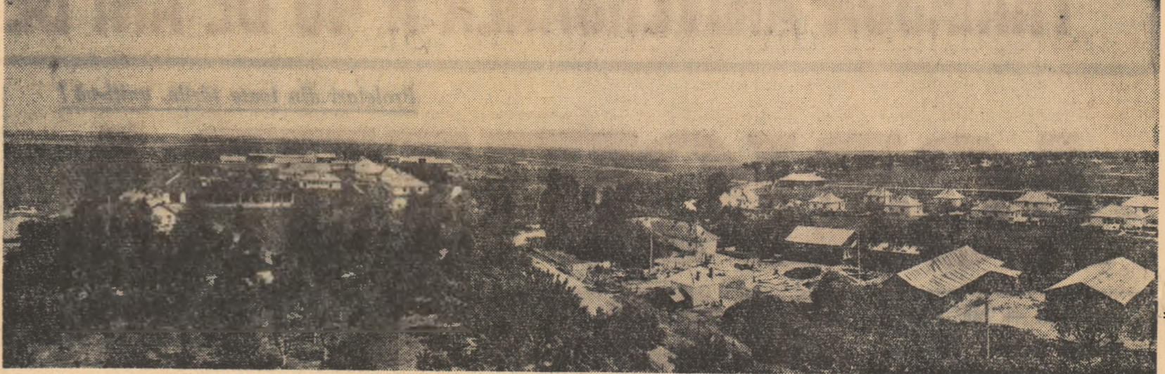
Vedere parțială a gospodăriei agricole de stat Urleasca — regiunea Galați