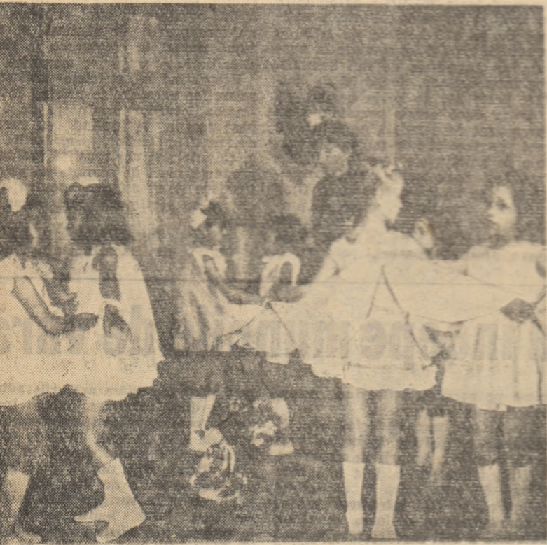
Iată o scenă obișnuită astăzi în grădinițele de copii. Micile balerine care pregătesc emoționante programe artistice pentru „Ziua internațională a copilului” sînt copiii muncitorilor gospodăriei agricole de stat Caracal, regiunea Oltena.