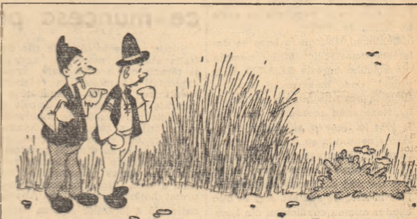
— Aici mi s-a răsturnat astăzi toamnă cărăuș cu gunoi de grajd și mă treceam să-l arunc! Desen de C. CRĂCIUN

Gospodăria agricolă colectivă „7 Noiembrie” din Anzulești, raionul Băilești, are prevăzut ca anul acesta să obțină recolte sporite la hectar. De aceea a contractat cu statul 88 tone de grâu, 100 tone de floarea-soarelui, 38 tone de porumb boabe și alte cantități de produse vegetale și animale.