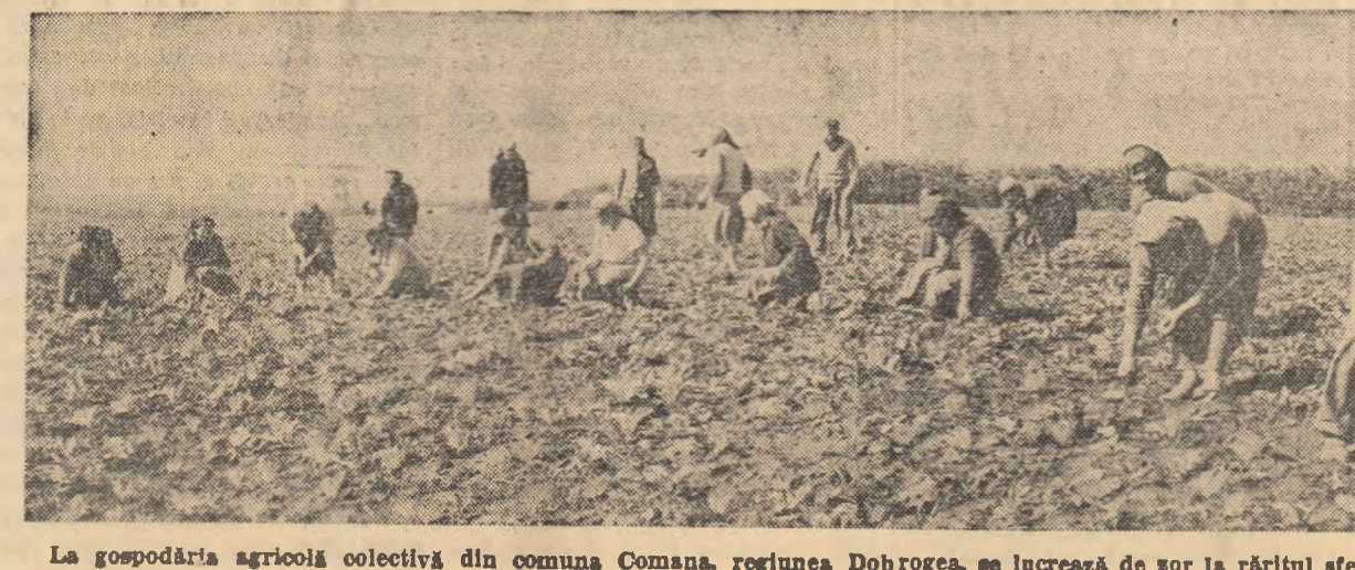
La gospodăria agricolă colectivă din comuna Comana, regiunea Dobrogea, se lucrează de sor la rîritul stelei de zahăr, după cum se vede în fotografia

Directivile celui de-al III-lea Congres al P.M.R. trasează gospodării agricole de stat sarcina ca în următorii ani să sporească numărul de animale, producția de furaje pe unitatea de suprafață și să livreze produse alimentare în cantități tot mai mari și la un preț de cost cit mai redus.