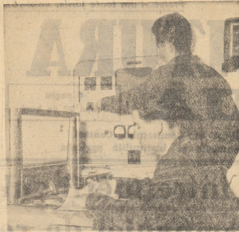
În comuna Drăgoș Vodă, regiunea București, peste 450 de colectiviști și-au instalat difuzoare. În fotografie: la stația de radioamplificare în timpul unei emisiuni.

se” demasca din nou mirăviile unor traficanți care vind copiii italieni în Statele Unite cu 750 de dolari bucata. Chipul monstruos al capitalismului vestește copilăria, o fură, bălăcurește viitorul generațiilor tinere pregătindu-le să fie carne de tun pentru interesele afaceriștilor monopolizati. Dar popoarele iubitoare de pace din toate continentele își ridică cu tărie glasul împotriva războiului. Ele vor ca fiii și fițele lor să crească sub un cer luminos și senin, să se bucure de frumusețea copilăriei, a adolescenței, să aibă parte de o viață demnă, omenească. Văstările lumii trebuie să trăiască și să crească în pace, să ajungă oameni de nădejde, oameni adevărați.