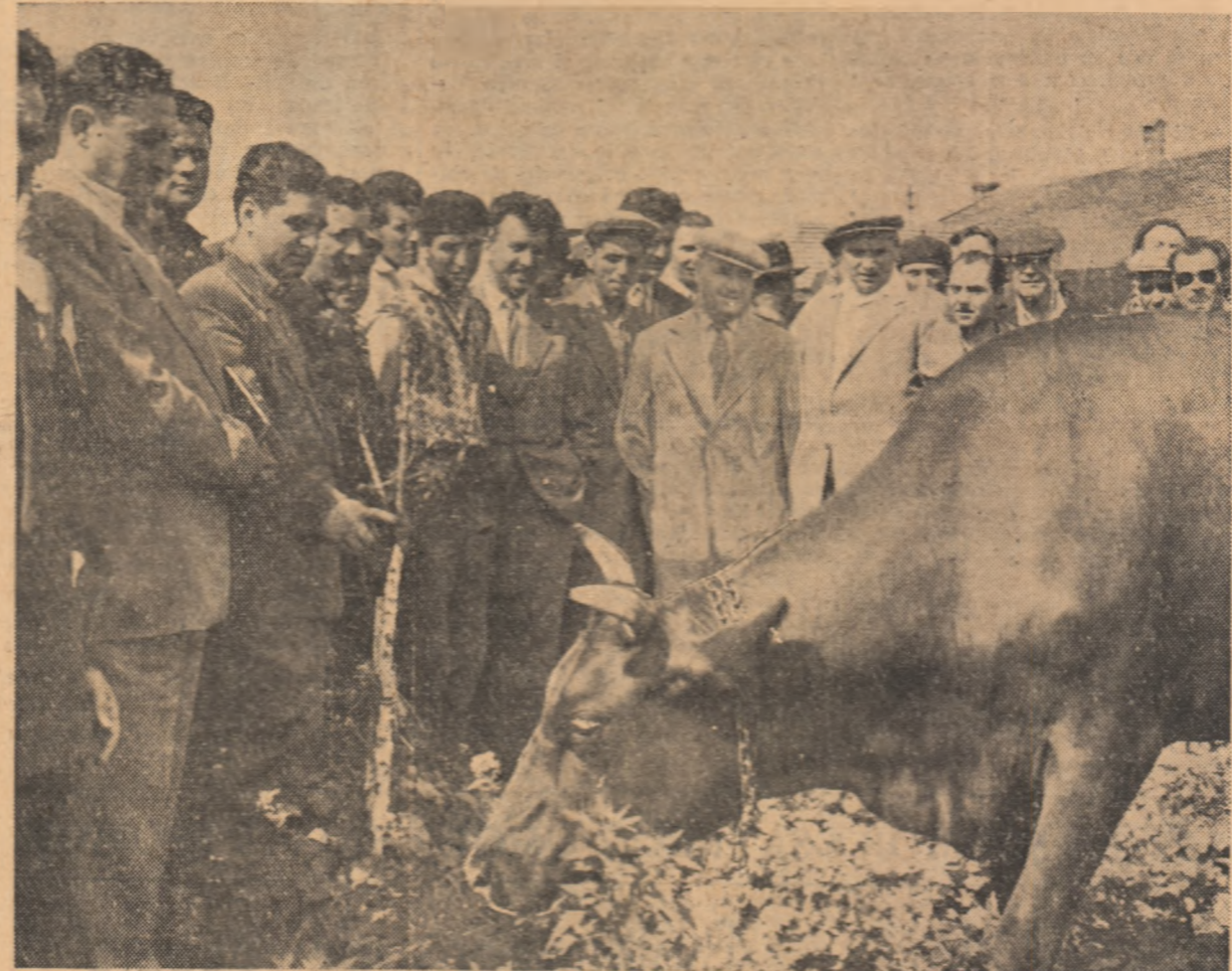
În timpul vizitării fermei de taurine, atenția participanților s-a îndreptat spre vaca „Porumbița”