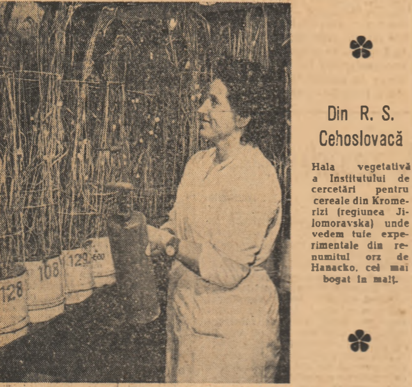
Din R. S. Cehoslovacă

exploata pe țărani rămași fără pămînt sau cu pămînt puțin. Propunîndu-și să sporească producția agricolă, astfel încît Pakistanul care este o țară agricolă să nu mai cheltuiască milioane de dolari și lire sterline pentru a cumpăra produse alimentare din alte țări, guvernul Ayub-Khan a inițiat în acest scop un program experimental. Acest program prevede aplicarea unui complex de măsuri pe baza generalizării experienței unui „fermier avansat” — colonelul Conroy care strînge de pe pămîntul său o recoltă mult mai ridicată față de cea a pedicilor. Oricine înțelegă însă că metoda capitalistă de cultivare a pămîntului practicată de „fermierul avansat” nu pot salva țărănimia muncitoare pakistaneză de la mizerie, de la înăpăstare. În condițiile agriculturii bazate pe fărîmîntarea pămînturilor, exploatarea de moșieri și chibaburi, țărăni muncitori din Pakistan n-au nici măcar puțină șansă de a cumpere inventarul agricol de strictă necesitate. Principalele unelte agricole ale țărănilor pakistanezi sînt plugul de lemn și săpăliga. Programul inițiat de guvern prevede să li se vîndă țărănilor pluguri de fier cu corman, dar acestia n-au pur și simplu cu ce să le cumpere. Nu e de mirare deci, că în Pakistan țărăni lucrează tot cu pluguri de lemn.