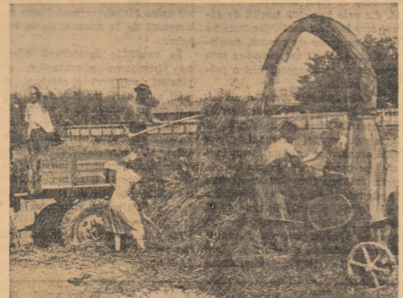
În fotografie: un aspect de la demonstrația practică de însilozare a lucernei ce a avut loc la Stațiunea experimentală zootehnică Slobozia