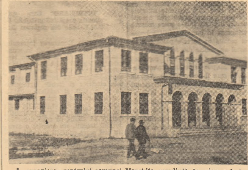
În apropierea centrului comunei Marghita, reședință de raion, a fost construită în anul trecut o frumoasă casă de cultură