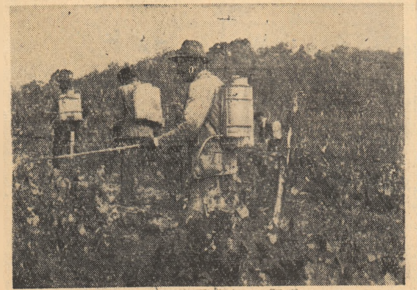
Stropitul al 2-lea la gospodăria agricolă de stat Corcova, regiunea Oltenia, este în to.