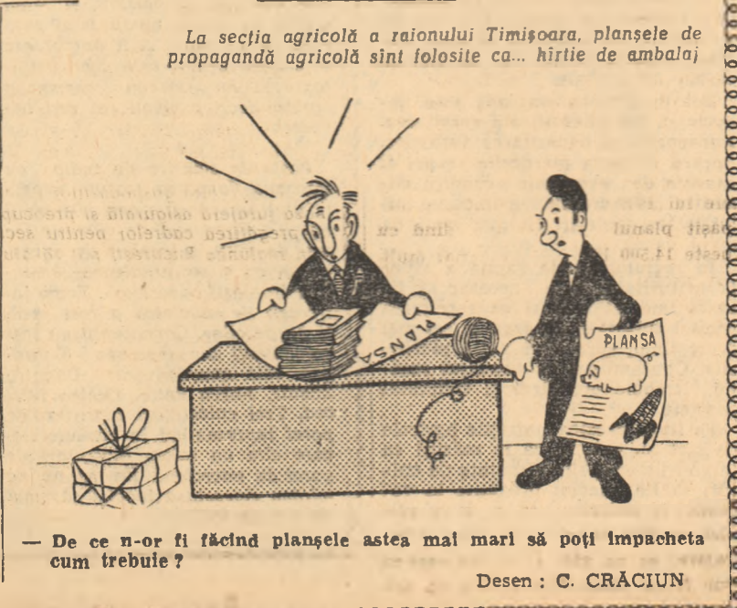
— De ce n-or fi făcînd planșele astea mai mari să poți împacheta cum trebuie? Desen: C. CRĂCIUN

Răscîndu-și o mustăță. S-a sculat de dimineață. C-are cincizeci de nepoate. Să le crească mari pe toate. (Spic) A sosit din fabrică, O fetiță harnică Care-noată pin la brîu Treierînd lanul de grîu. (Combina)