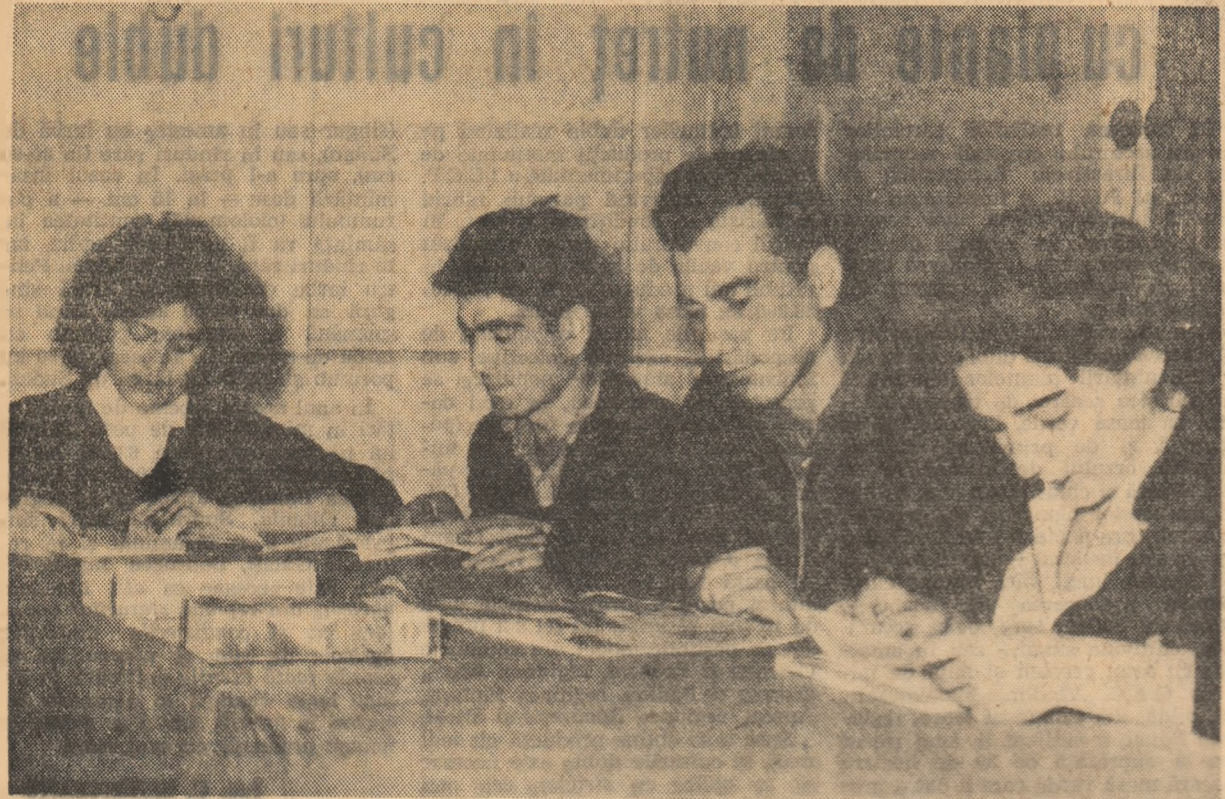
La colțul roșu al gospodăriei agricole de stat Noul din raionul Sibiu, numeroși tineri se adună în fiecare seară. Aici ei citesc ultimele ziare și reviste sosește peste zi, discută ultimele cărți citite, fac schimb de păreri cu privire la metodele noi expuse în broșurile de specialitate