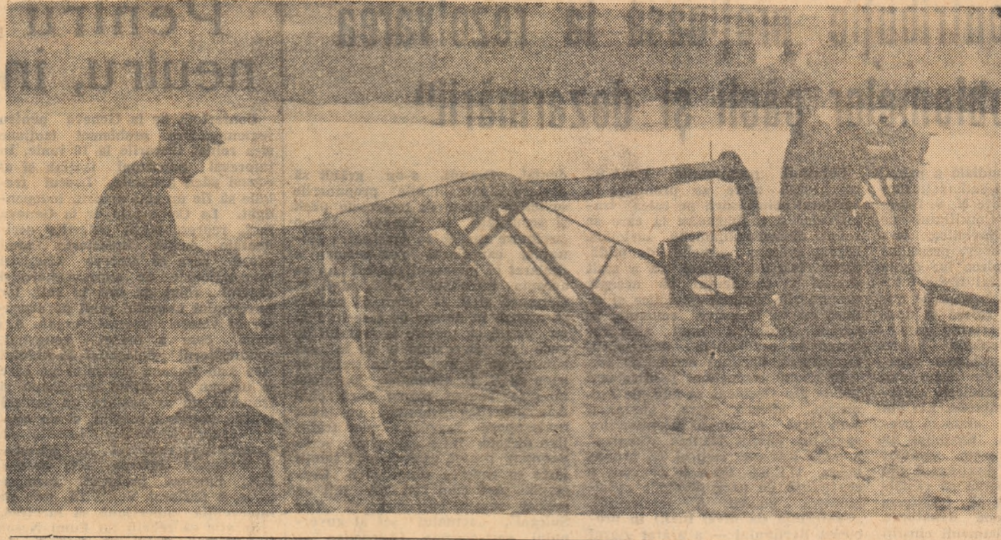
Stația de pompare Gospodăria agricolă colectivă din Mărușești, raionul Pașcani, cultivă anul acesta, între altele, și 25 de ha cu legume și zarzavaturi care sînt irigate. În fotografie: stația de pompare, aflată la marginea grădini gospodăriei

În cadrul unei consfățiri a creșcătorilor de animale din regiunea noastră, gospodăria agricolă colectivă din comuna Cistei, raionul Alba a chemat la întrecere toate gospodăriile colective din regiune. Participanții la consfățire au primit cu mare însuflețire întrecerea. Chemarea fiind analizată de către consiliul de conducere al gospodăriei noastre colective, s-a constatat că avem condiții ce ne permit nu numai să realizăm obiectivele stabilite în chemare, ci chiar să le depășim. Astfel, față de 26 capete bovine la fiecare sută de hectare teren cit și-au propus să realizeze veninți noștri din Cistei pînă la sfîrșitul anului, noi ne-am propus să realizăm o încălcătură de 28 capete bovine la fiecare sută de hectare.