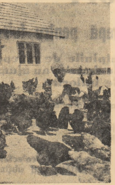
Gospodăria colectivă din Ginciova, regiunea Oltenia, pune un accent deosebit pe creșterea păsărilor. Bunăoară, în acest an gospodăria crește peste 2.500 de găini ouătoare. În fotografie, una din ingrijitoarele fruntașe.