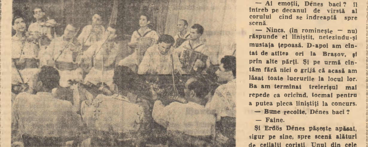
Un aspect obișnuit de la cel de-al VI-lea concurs al formațiilor artistice de amatori. Pe scenă țaraful colectivștilor din comuna Pietroșani regiunea București, cîntă o suită de melodii populare locale