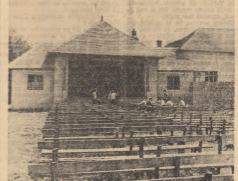
Colectivștii din comuna Basarabi, raionul Calafat, au construit în acest an un teatru de vară cu o capacitate de 300 de locuri

De undeva, de departe, sau poate chiar din spatele bădăcii, cineva, un soldat desigur, lovit de dor sau de singurătate, a prins să fluiera o doină, veche, oltenească. Viersul picura molcom, tremura cite-o clipă neliniștit, apoi se-mbărdăia deodată în șuier puternic, haiducească, dirz... Frontul era aproape de inima țării... Armatele eliberatoare sovietice, venite de departe, din Răsărit, ciocăneau cu pumnii de oșel în zălele lanțurilor de robi, în porțile închisorilor noastre. Înapoia ferestrelor și după uși, la orașe, în spatele gratiilor ochilor și