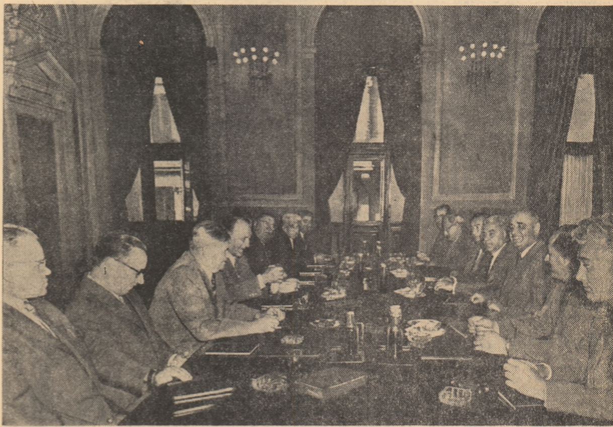
În timpul convorbirilor dintre delegațiile P.M.R. și P.M.S.U.

Delegația de partid și guvernamentală a R. P. Romine condusă de tovarășul Gheorghe Gheorghiu-Dej, care se află în vizită de prietenie în R. P. Ungară la invitația C.C. al Partidului Muncitoresc Socialist Ungar și a guvernului Revoluționar Muncitoresc Tărănesc Ungar, ca răspuns la vizita pe care o delegație de partid și guvernamentală a R. P. Ungare a făcut-o în țara noastră în anul 1958, s-a bucurat de o călduroasă primire în țara vecină și prietenă. Prelunduși solișii poporului român au fost salutați cu dragoste și bucurie de oamenii muncii din R. P. Ungară. Primirea caldă, tovarășească, a delegației de partid și guvernamentale a R. P. Romine, este încă o dovadă a sentimentelor frățiești care leagă popoarele romin și ungar.