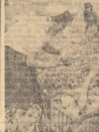
La gospodăria colectivă din comuna Bragadiru, regiunea București, recoltările în grădina de legume s-au intensificat.

În fotografie: un grup de muncitori la recoltatul ardeiilor grași.