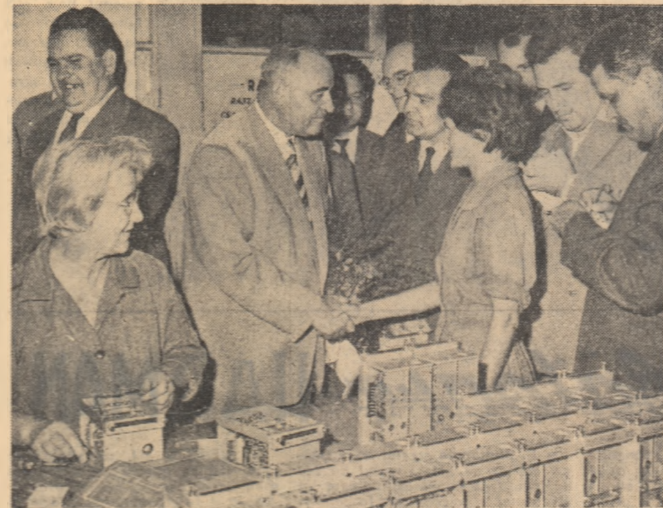
Tovarășul Gh. Gheorghiu-Dej sînd de vorbă cu un grup de muncitori la fabrica de utilaje de telecomunicații din Budapesta

Vizita delegației de partid și guvernamentale a țării noastre în frunte cu tovarășul Gheorghiu-Dej, înfălițarea soților poporului romîni cu oamenii muncii maghiari, constituie noi dovezi de dragoste și prietenie frățească dintre popoarele romîni și ungar.