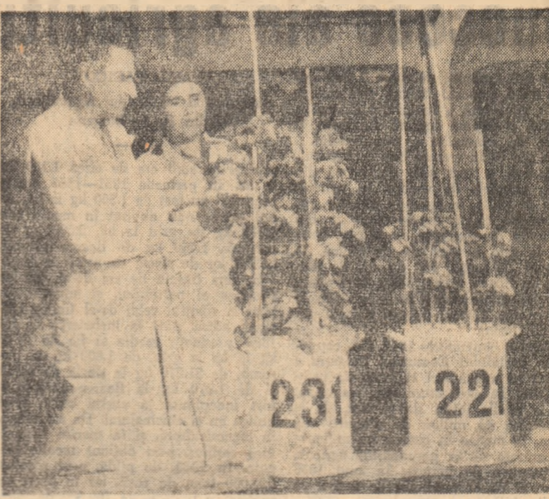
În aceste două vase s-au semănat în același timp, aceeași soi de cartofi. Vasul din dreapta a fost supus secetei la cîștigul de oclire în timpul imbobocirii. Datorită acestui fapt, planta a rămas mai mică și rodește mult mai puțin. Experiențe multiple de acest gen se fac la casa de vegetație a Institutului de cercetări agricole. Ele au ca scop studierea influenței apei și îngrășămintelor asupra plantelor. Pe baza rezultatelor obținute în urma cercetărilor, se dau îndrumări cu privire la nevoia de apă și îngrășăminte în diverse perioade ale vegetației plantelor.