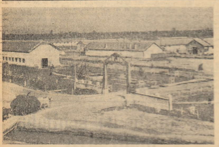
Sediul cooperativei agricole de muncă din satul Dfigo Pola, districtul Plovdiv.

Marile succese înregistrate în agricultura țării noastre sînt roadele muncii creatoare a cooperativilor și mecanizatorilor, a muncitorilor din gospodăriile agricole de stat, a specialiștilor din agricultură. Aceste succese sînt o urmare directă, firească, a însemnatei munci de organizare, îndrumare și sprijinire dusă de partid și guvern. Călăuzindu-se după bogata experiență a Uniunii Sovietice și sprijinindu-se pe ajutorul fratrec, multilateral al acesteia, ca și pe al celorlalte țări ale lagărului socialist, poporul nostru muncitor a transformat agricultura țării dintr-o agricultură împotrivă, într-una înfloritoare, demnă de un popor liber, într-una liberă.