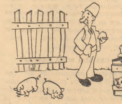
Cumpărătorul: — Cel doi nu mai încep! — Nu-ți nimic, îl păstrăm pentru prăsiți și pentru îngrășat.

Gospodăria colectivă din satul Caraiman, comuna Ioan Corvin, raionul Adam Clisi, din 89 porci n-a reținut decît 2, restul vînzîndu-i.