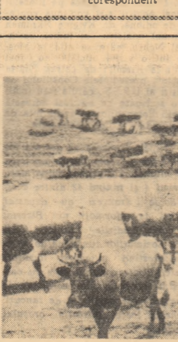
O parte din cîreada de vaci care numără 80 de capete, a gospodăriei colective din comuna Știubieni, regiunea Suceava