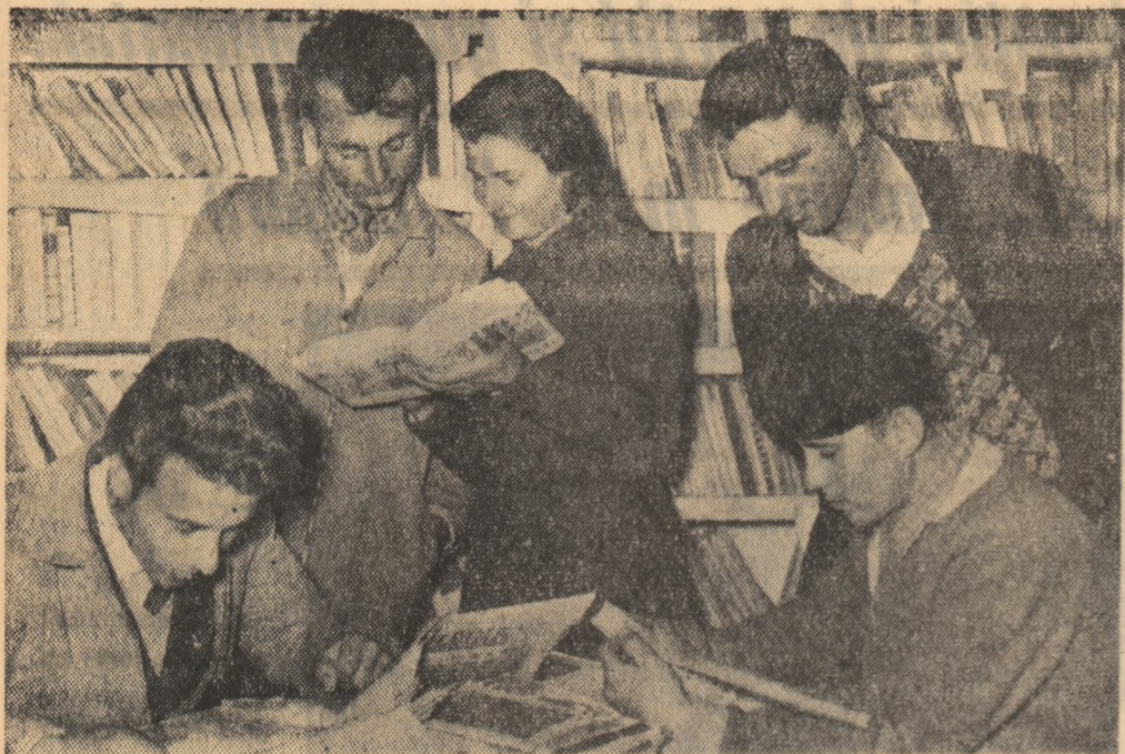
Biblioteca câminului cultural din comuna Dobru, raionul Bals, este bine aprovizionată cu cărți literare, de știință popularizată, broșuri agro-tehnice, etc., potrivit nevoilor și gustului țăranilor muncitori