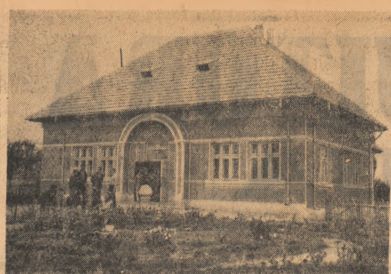
De curînd în comuna Cîndești, regiunea Galați, a fost dat în folosință un frumos cămin cultural construit prin muncă voluntară și contribuție bănească.

Încheiere vorbitorul a urât din toată inima săi succese în nobila activitate pe tărîmul stringerii legăturilor dintre popoarele U.R.S.S. și R.P. Romine. Custinițele au fost subliniate în repetate rânduri de vii aplauze, participarea la adunare au manifestat îndelung pentru prietenia de nezdruțită dintre poporul român și popoarele Uniunii Sovietice. A urmat un program artistic.