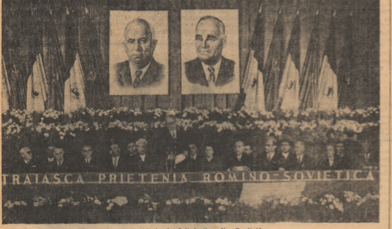
Prezidiul adunării festive din Capitală.