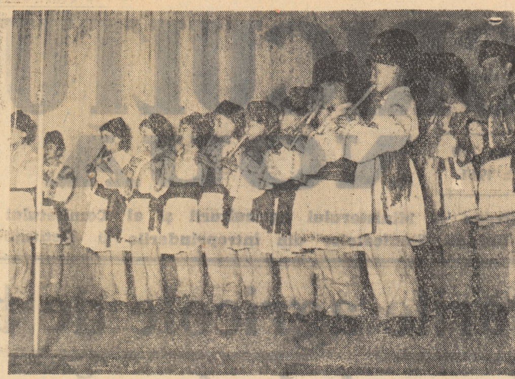
Echipa de fluteraşi din comuna Căluş, raionul Ploieşti, a obţinut anul acesta premiul al II-lea în întrecerea finală cu cele mai bune formaţii din ţară.