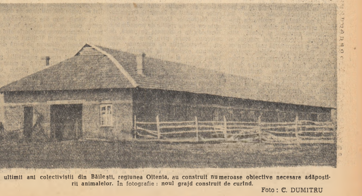
În ultimul an colectivității din Bălești, regiunea Oltenia, au construit numeroase obiective necesare adăposturilor animalelor. În fotografie: noul grajd construit de curînd.