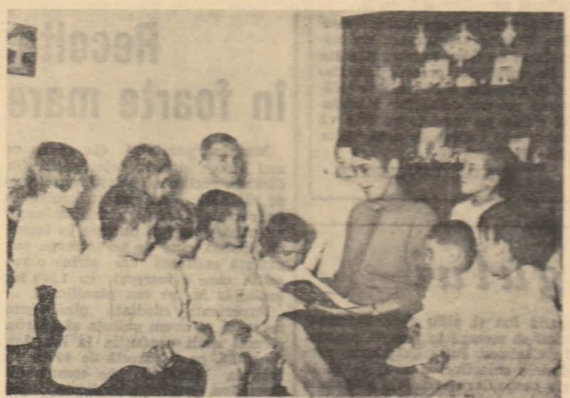
„Încălceci pe o șea și vă spun poveștea asta...”, început de la o cântare de copii ai gospodăriei de stat Ștefănești, regiunea Argeș.