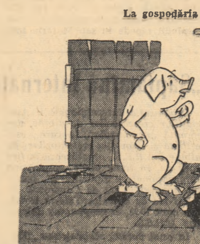
— Unde te-ai accidentat? — În padocul ăsta!

trebuie să spuneți cuvîntului de la sfîrșit chiar pe nume: Haine stau coala grămădă Și-e flaua și un cleșap, Printre bancuri, chei și freze Flîndră n-avem un... — Dulap! — Extrasordinar. Ați ghicit-o și pasha, rămîine de văzut cînd le-er gheste și tovarășii din conducerea stațiunii, cînd vor fi tot atît de... perspicaci... Mai alas că se apropie repațiile de iarnă, iar în atelierul me-