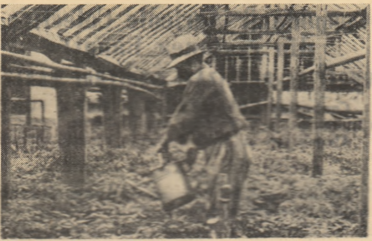
Culturile de cere și gospodăria colectivă din comuna Cițcău, regiunea Cluj, au adus până în prezent în acest an un venit de 70.000 lei. În fotografie: aspect de la udatul reștilor în cere.