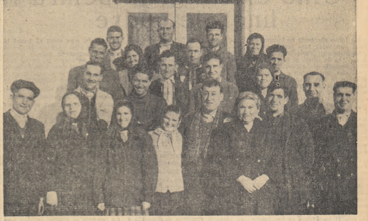
Delegații raionului Alexandria la Consfăturile pe țară a țărănilor colectivități.

Consfăturile raionale ale colectivităților pentru alegerea delegațiilor la Consfăturile pe țară sînt în plină desfășurare. Delegații la consfăturile raionale dezbate și însușește munca de pînă acum, chibzulese gospodăresc ce trebuie făcut pentru o și mai puternică dezvoltare a gospodăriilor colective și încredințează celor mai buni dintre ei mandatul de a-l reprezenta la marea adunare a colectivităților din Capitala țării.