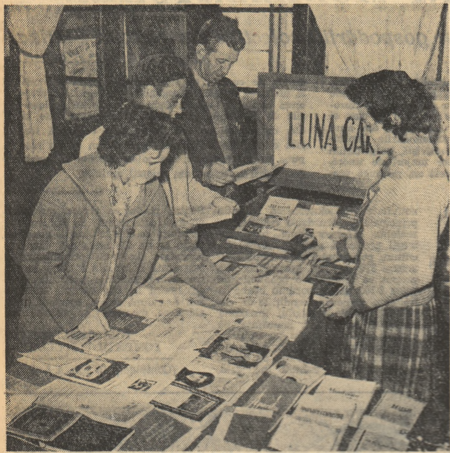
„Luna cărții la sate” Stând de cărți cu vînzare în becul căminului cultural din comuna Lipănești, regiunea Ploiești.

C. BĂRBĂCĂRU și C. ZCHISCHERU corespondenți