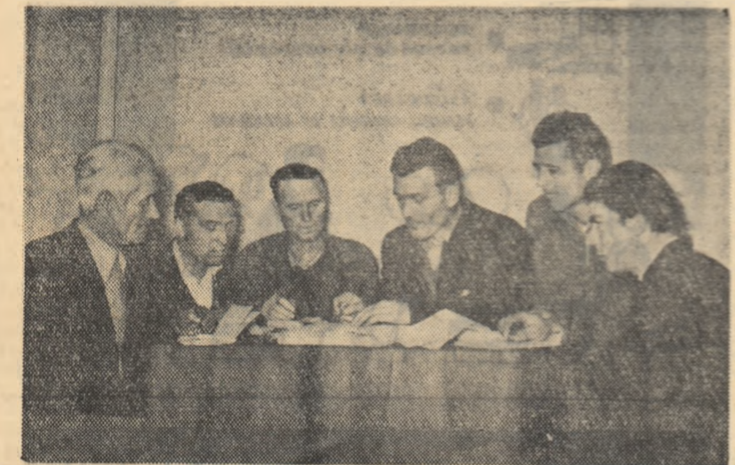
Pentru anul acesta, colectivistii din Băbicleu, raionul Caracal, și-au prevăzut în planul de producție sarcini sporite și în sectorul zootehnic. În fotografie: președintele gospodăriei împreună cu responsabilii fermelor de animale discutînd asupra măsurilor ce trebuie luate pentru îndeplinirea sarcinilor stabilite în plan.