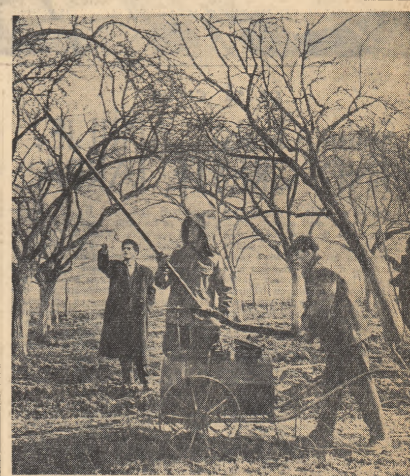
Stropitul de iarnă al pomilor la gospodăria agricolă de stat Tigveni, regiunea Galați.

Încă din timpul verii serviciile tehnice din aceste stațiuni s-au îngrijit de a se aproviziona cu unele