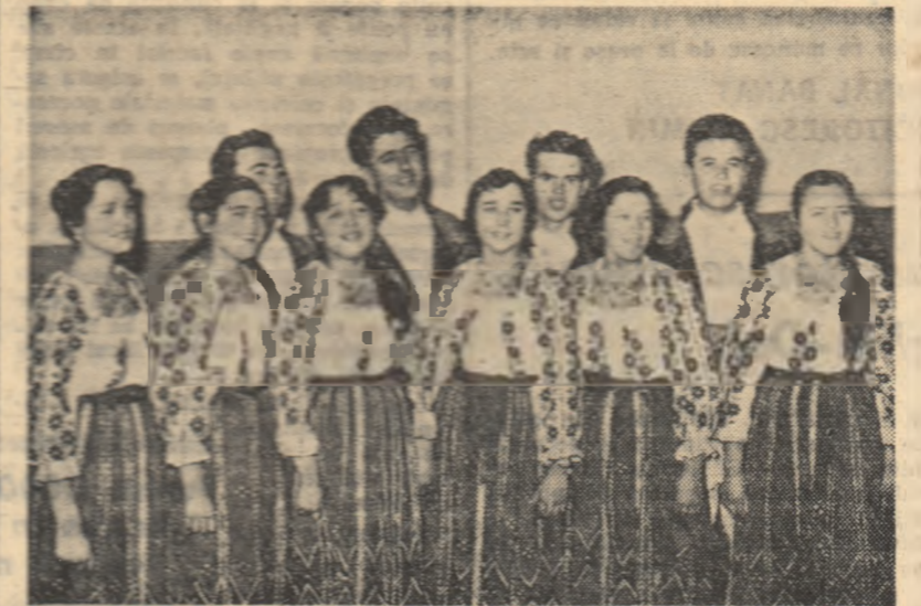
„Tinerii veseli” — așa le spon solicitat, membrilor brigăzii artistice de agitație din comuna Manastira, raionul Urziceni. Înaintea și versurii tinerii artiști amatori vorbesc de realizările din comună, de munca fructuoasă. Totodată, brigada nu-i uită nici pe cei care se lasă pe tinerii. Actualul program al brigăzii este inspirat din strădania și preocuparea permanentă a colectivității de a dezvolta toate sectoarele de activitate — însoțite de mari rezultate.